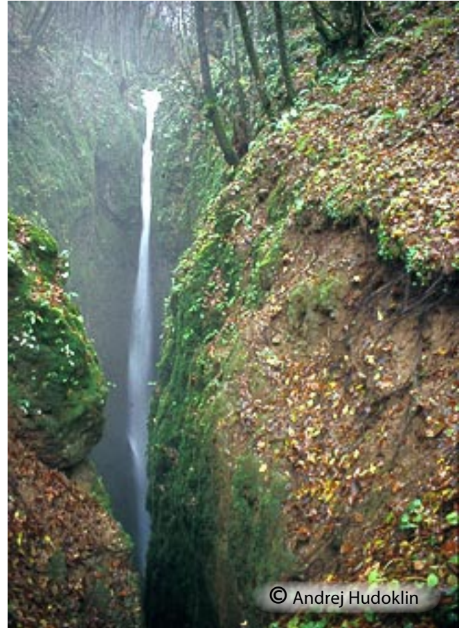
Brezno je nastalo ob lokalnem prelomu.