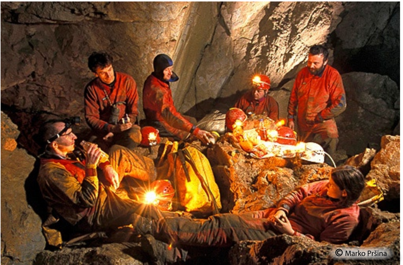
Pred potopom v Veliki sifon.