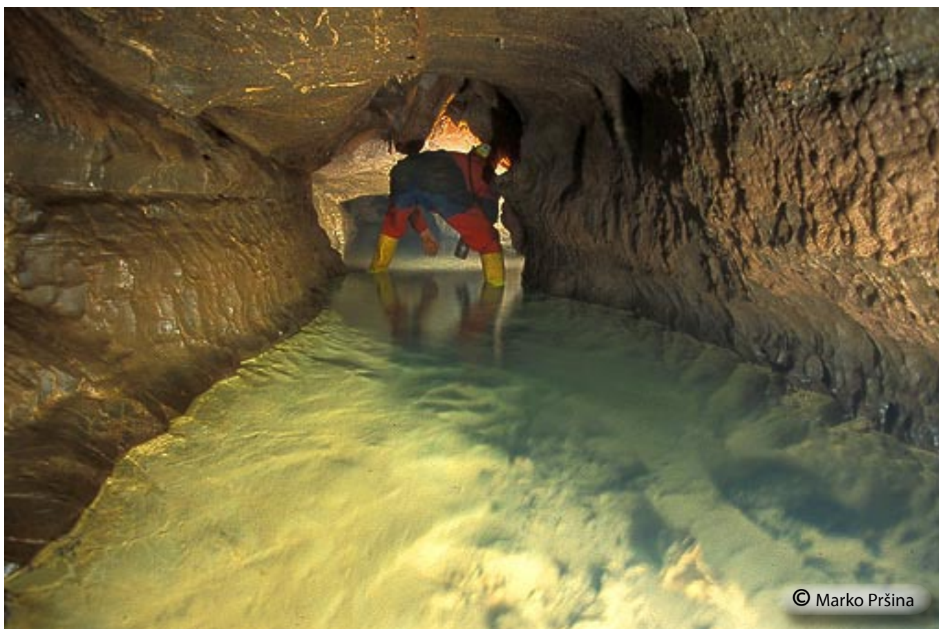
Vodni rov v zadnjem delu jame.