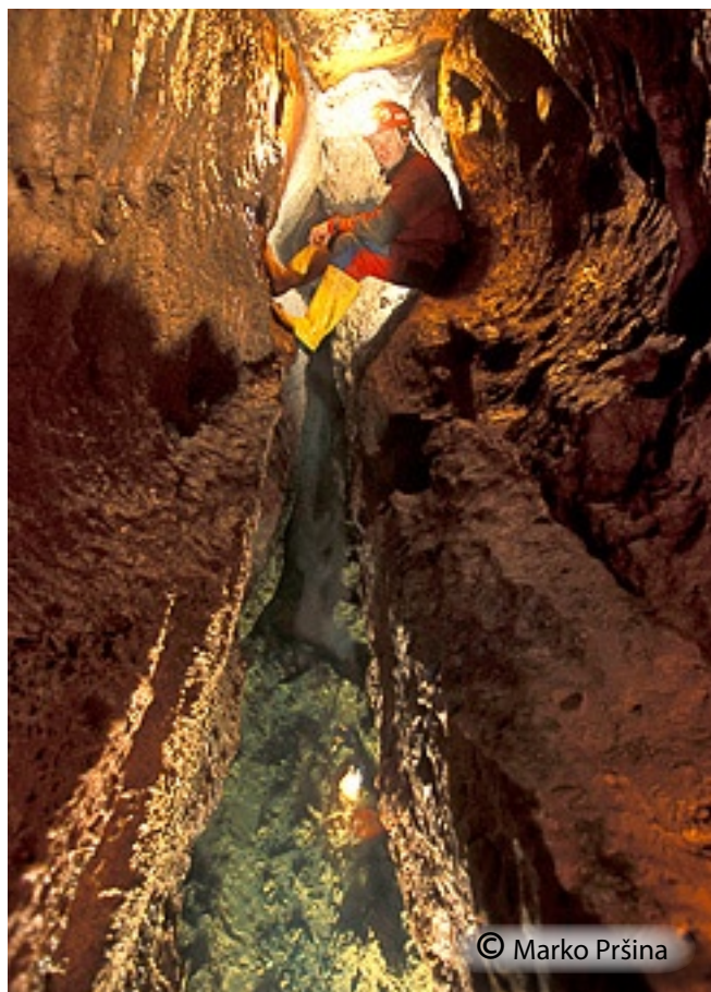
Značilni erozijski vodni rov v obliki ključavnice.