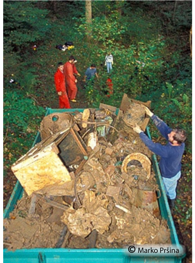
Še ena napolnjena traktorska prikolica odpadkov.