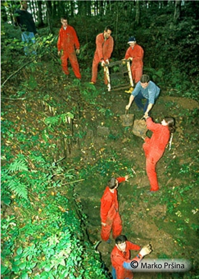
Člani JK Novo mesto čistijo Shornico.