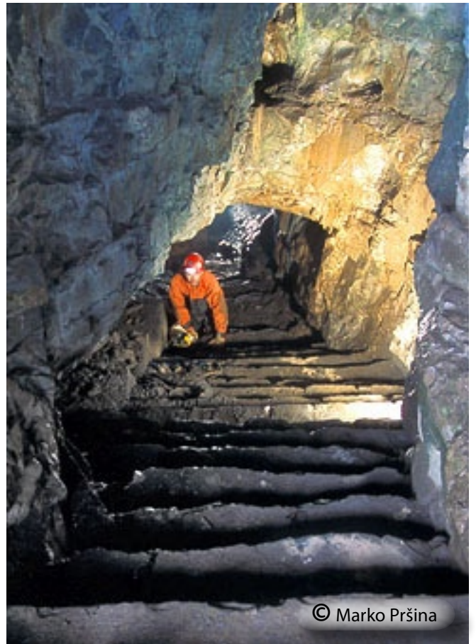
V vhodni rov vodijo stopnice.

1: Zasuta jama, 2: Zgornja jama, 3: Črničkova jama (3A - Blatni rov, 3B - Vodnjak, 3C - Jezero), 4: Srednja jama, 5: Bruhalnik za Javornikovo žago.