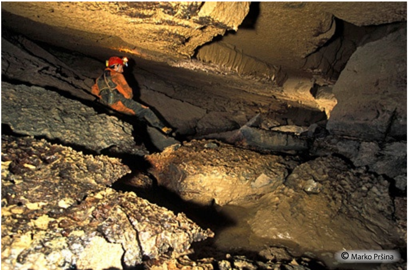
Močno erodiran osrednji rov pri Vodnjaku.