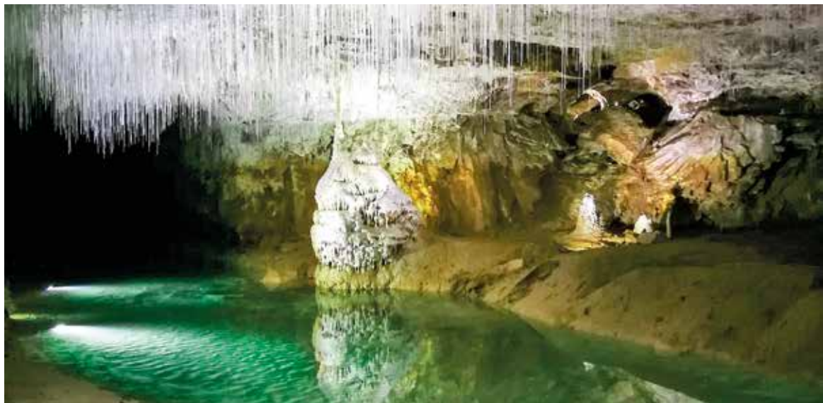
Izjemni beli »špageti« – eden lepših prizorov iz jame Grotte de Choranche.