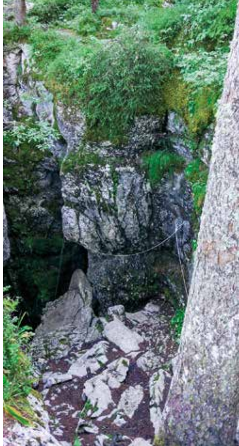
Glavni vhod v Gouffre Berger.

Matija, Tomaž, Jure in Jasna smo se spustili kot druga skupina. Na dnu 15-metrskega vstopnega jaška je ozek prehod za odprtimi jeklenimi vrati vodil do vrha jaška Ruiz, kjer so se nad 30-metrskim jaškom raztezali dvomljivi leseni nosilci. Takoj sledi strm spust Holliday Slides in nato spust do vrha impresivnega 30-metrskega jaška Cairn. Na dnu jaška smo po prodnatem dnu prišli do začetka Meandra, globoke vijugaste razpoke »brez dna«. Ta je zahtevna, še posebej na poti nazaj, ko si utrujen in ti noge ne služijo več, kot bi morale. Zame je bil vsekakor izziv, še posebej prehod po dvomljivih lesenih stebričkih, ki mi niso vlivali zaupanja. Po 150 m smo prišli do brezna Garby, malo hodili in se nato še