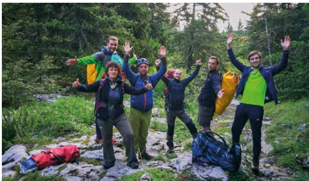
Člani odprave na poti do vhoda v Gouffre Berger.

100 m premetavali po meandrih pred breznom Gontard. Sledili so trije relativno kratki spusti do vrha brezna Aldo, lepega 40-metrskega prostega raztežaja. Nato nas je kratek rov vodil v Veliko galerijo (Grande Galerie) na -250 m, kjer se je značaj jame nenadoma spremenil. Ko smo iz majhnega hodnika prišli v velikanski rov, širok 30 m in visok 20 m, smo zagledali reko brez zvezd (Starless River). Sledili smo ji nekaj sto metrov do jezera Cadoux in nato nadaljevali pot čez kupe razbitin, pod katerimi je reka izginila. Kalcitne tvorbe so postajale vse pogostejše in sledil je spust po več slapovih. Nadaljevali