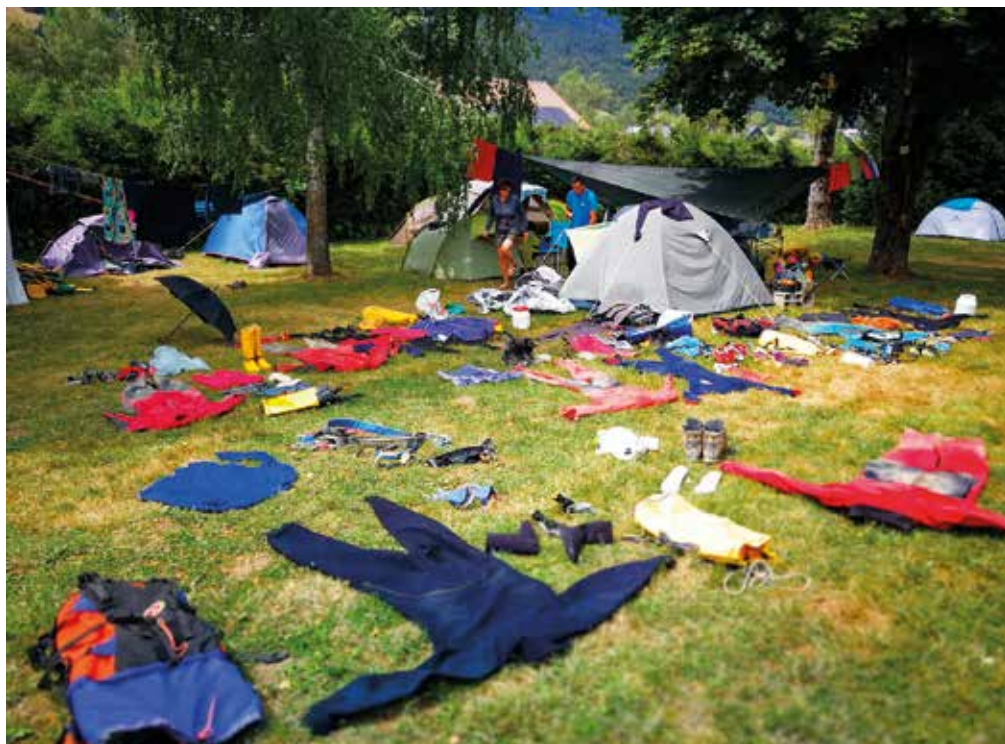
Sušenje opreme v kampu po uspešno zaključeni akciji.