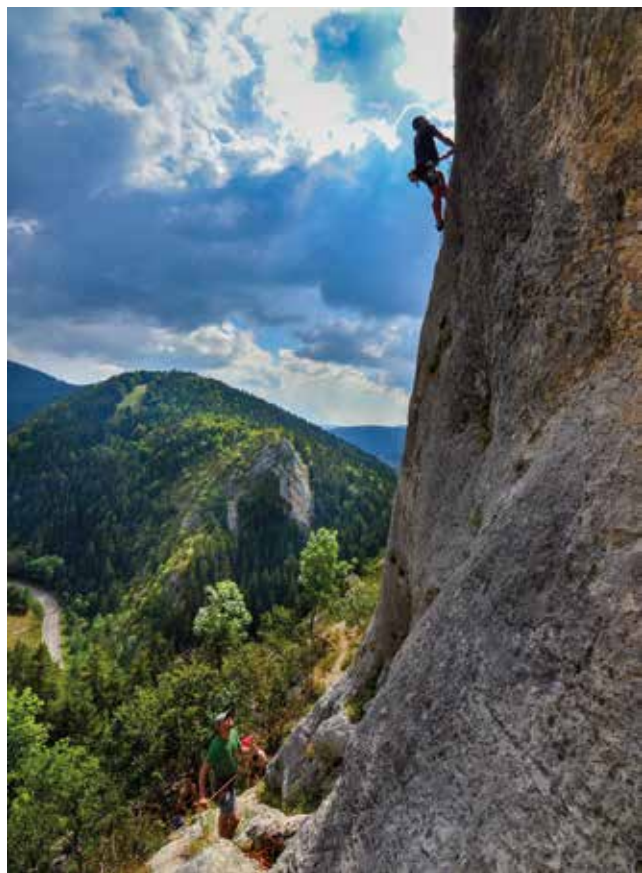
V plezališču Lans-en-Vercors.

V četrtek je ves dan deževalo in ta dan v jamo ni vstopil nihče. Turobno vreme smo izkoristili za pripravo opreme za akcijo naslednjega dne. Popoldne