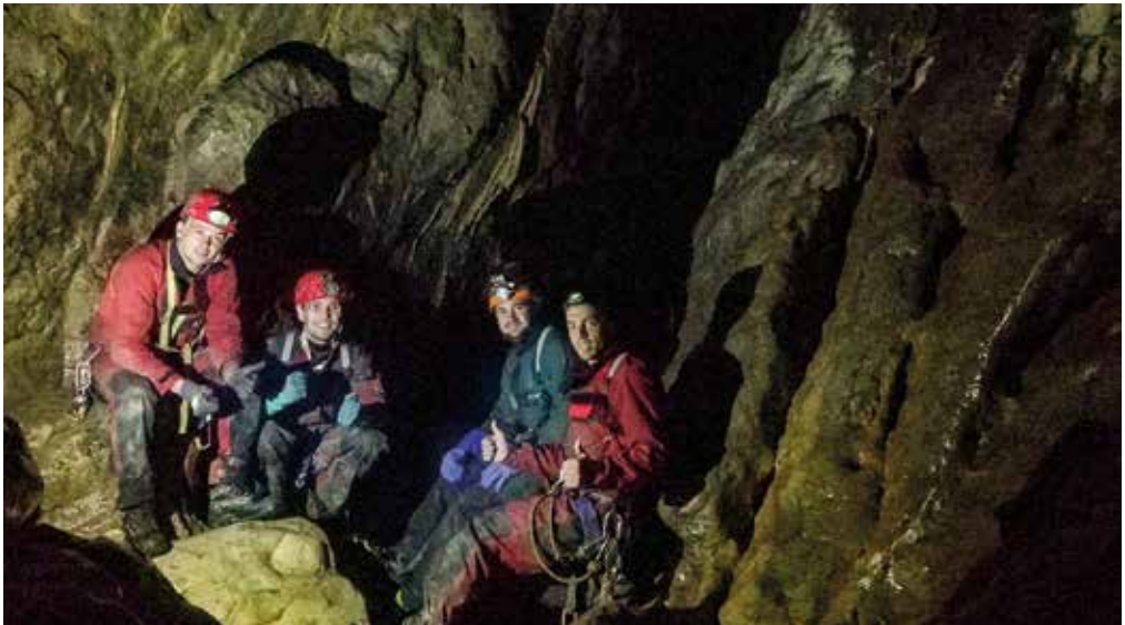
Po osmih urah smo dosegli naš cilj – kanjon pred prvim sifonom na globini 1100 m.

Druga skupina je hitro dosegla kritični odsek imenovan Les Coufinades na globini 640 m. Tam je treba premagati vodni kanjon s pomočjo prečnic, napetih na stenah le nekaj metrov nad vodo. Na njihovo veliko srečo so ugotovili, da je od deževja narasla voda že toliko upadla, da jim je omogočila varno nadaljevanje proti dnu. Vseeno pa to ni pomenilo brezskrbnega nadaljevanja, saj so bili najtežji odseki jame šele pred njimi. Izognili so se vsem pastem načetih vrvi in milo rečeno dvomljivemu opremljanju ter