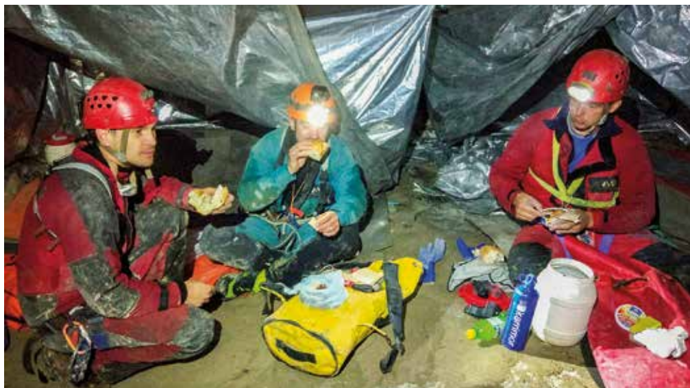
Zaslužno okrepčilo v prvem taboru pred s kapniki okrašeno Dvorano trinajstih.

100 m premetavali po meandrih pred breznom Gontard. Sledili so trije relativno kratki spusti do vrha brezna Aldo, lepega 40-metrskega prostega raztežaja. Nato nas je kratek rov vodil v Veliko galerijo (Grande Galerie) na -250 m, kjer se je značaj jame nenadoma spremenil. Ko smo iz majhnega hodnika prišli v velikanski rov, širok 30 m in visok 20 m, smo zagledali reko brez zvezd (Starless River). Sledili smo ji nekaj sto metrov do jezera Cadoux in nato nadaljevali pot čez kupe razbitin, pod katerimi je reka izginila. Kalcitne tvorbe so postajale vse pogostejše in sledil je spust po več slapovih. Nadaljevali