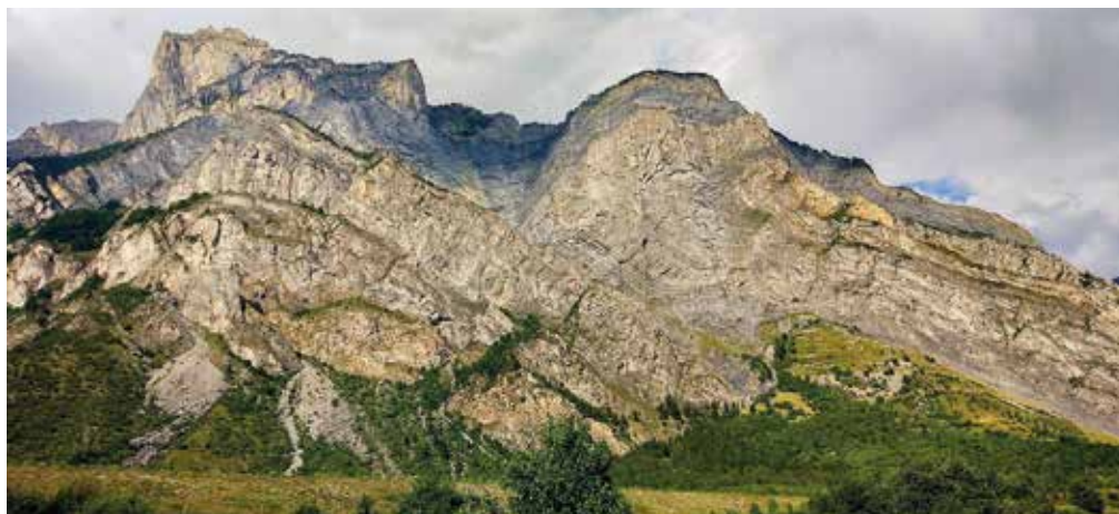
Močno nagubani apnenčasti skladi na poti do Grenobla.