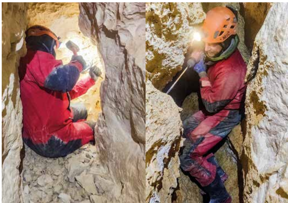
Meandra tovarištva smo se lotili z mišicami, pa tudi s pomočjo električne energije.

Vendar vse ni potekalo po naših željah. Že prvi meander, skozi katerega so se že prebili prvi raziskovalci, se je izkazal za zelo zahtevnega. Porabili smo skoraj dve celi akciji, da smo se le prebili skozenj in pozneje še dve, da smo omogočili udoben prehod. Nato smo se lotili še drugega meandra, ki nam tudi ni prizanašal, saj smo se v prvem