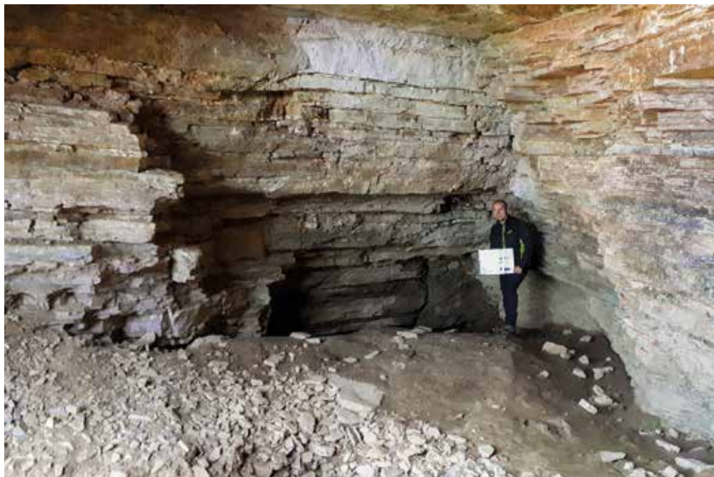
Ajdovska jama pri Krškem – pred vhodom v rov s sifonom.