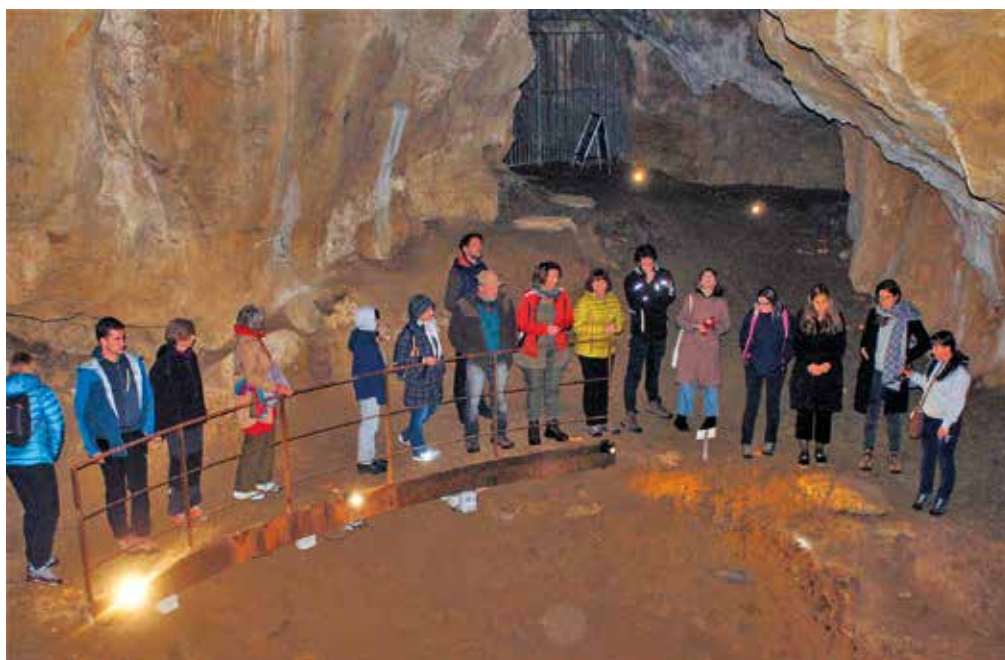
V Ajdovski jami pri Nemški vasi.

1934 ob gradnji ceste. V njej so istega leta našli ostaline iz starejše kamene dobe. Ajdov grob je gomila iz starejše železne dobe, žal že dolgo tega izropana.