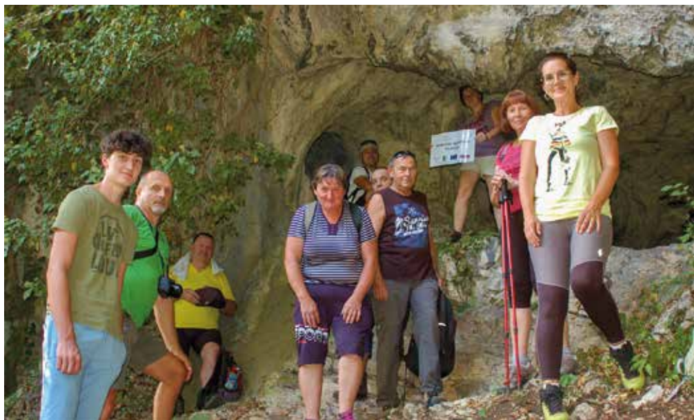
Pred vhodom v Ajdovsko peč na Bohorju.

Kot po pravilu vedno, ko iščemo ajdovske lokacije, naletimo ob tem še na prave naravne bisere, tokrat na Bohorju. Tam smo avgusta 2021 odkrivali ajdovske sledi in izvedeli veliko zanimivih zgodb. Eno takih zatočišč je jama Ajdovska peč (kat. št. 8191) pod vasjo Lošče. To sta dva prosto dostopna spodmola. V večjem sta se med drugo svetovno vojno skrivali dve partizanski družini, ki sta v večjem spodmolu umetno izklesali manjše okno s prostorom za shrambo. O Ajdih velikanih govori tudi ljudsko izročilo, ki pravi, da naj bi v Ajdovski peči živela, verjetno z mačeho, ajdovska deklica Bojanca. Nekoč je pri slapu Pekel izgubila iglo, ki jo danes vidimo kot 15 m visok kamnit osamelec. Mačeho je to močno razjezilo, zato je Bojanco preklela, da je okamnela. Obraz okamnene Bojanke je še danes možno videti pri slapu Bojanca. Za nameček smo ob poti naleteli še na eno naravno vrednoto – Požunovo trto, ki je med najstarejšimi pri nas, pa gotovo tudi ena najdebelejših.