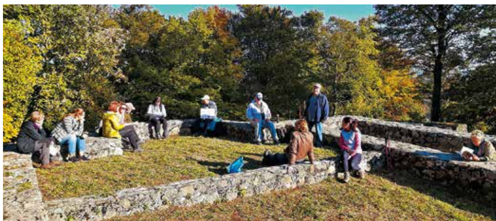
Na sončku sredi Ajdovskega gradca nad Sevnico.