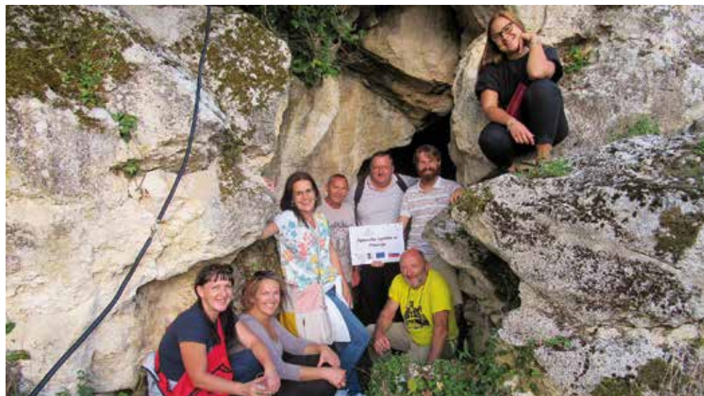
Člani skupine pred vhomom v Ajdovsko hišo na Silovcu.

V nadaljevanju popoldneva smo sončno svetlobo lovili še na sončnem Silovcu pri Sromljah in si ogledali omenjeno Ajdovsko hišo, lokacijo zakladnega depoja iz 2. tisočletja pred našim štetjem. Jama je arheološko najdišče iz pozne bronaste dobe in tudi antičnega časa. Gre za manjšo, suho, vodoravno jamo. Bila je zatočišče v različnih obdobjih zgodovine z lepo bero bronastih predmetov od srpov, sekiric, dleta, zapestnic, ovratnic, pa do bakrenih surovcev, kar predstavlja največji pozno bronastodobni depo v Posavju. V poznejših raziskavah so bili odkrite tudi sledi človekove prisotnosti v rimski dobi, med drugo svetovno vojno pa se je v njej skrivala skupina partizanov Kozjanskega odreda.