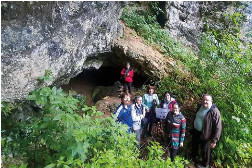
Pred vhodom v Levakovo jamo.

Arheološke raziskave so pokazale, da so ljudje jamo obiskovali oziroma v njej živeli že v eneolitiku oziroma bakreni dobi, starejši železni dobi, rimskem času in tudi pozni antiki. Posebno zanimiv predmet je verjetno bakrena sekirica iz konca 3. tisočletja pr. n. št., ki velja za najstarejši kovinski predmet v Posavju. Hrani ga Posavski muzej Brežice. Med naplavljenimi in izkopanimi predmeti so našli tudi neolitske artefakte, fragmente keramike, halštatske predmete, rimske novce ter ostanke človeških kosti. Vse najdbe so v Posavskem muzeju v Brežicah. Ogledali smo si zgolj vhodni rov, za nadaljnjih 300 m pa bi potrebovali že konkretno jamarsko opremo.