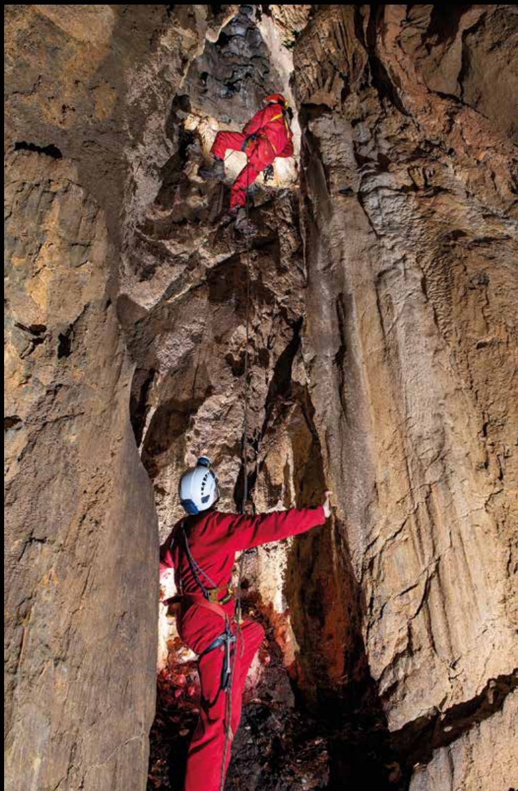
Vstopna vertikala Prhavčevega brezna.