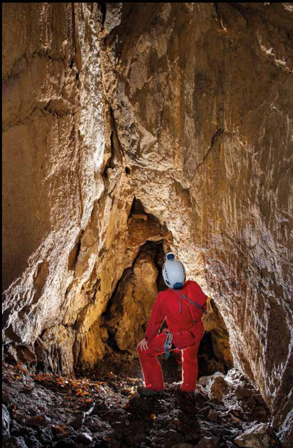
Vhodna dvorana se je razvila ob lokalnem prelomu.