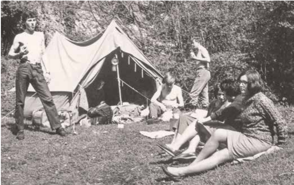
Spomin na mladost - Lojze (levo) z jamarji na taboru pred Kostanjeviško jamo oktobra 1964.