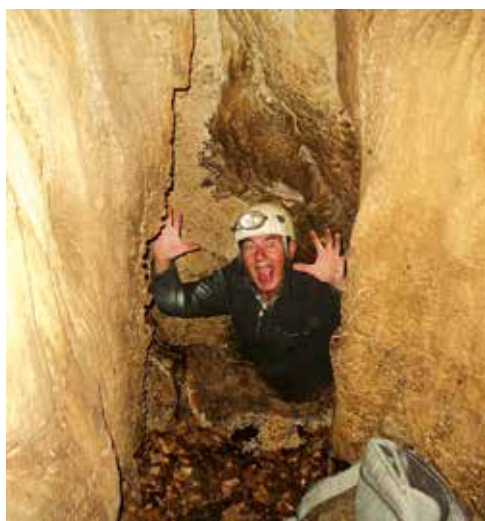
Tako je medo skočil iz lijaka.

Dobro leto potem sem julija znova obiskal jamo ter pogledal v medvedjo kamrico. Vhod v brlog je ozka razpoka, visoka pol metra, pri dnu široka 30 centimetrov ali za dve dlani, proti vrhu pa se oži. Ocenil sem, da se skozi razpoko brez širjenja ne bi mogel splaziti, medved pa se je lahko. Kamrica je 2 metra širok in okrogel prostor z nizkim stropom. Na tleh je veliko prinesenega listja, na katerem si je medved naredil prijetno ležišče.