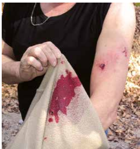
Žival'ca je malo grizljala.