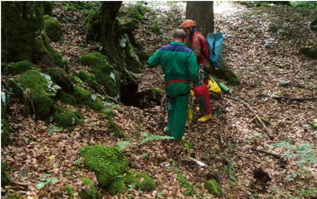
Pred vodom v jama.

Vhod v jama je bil prvotno ozka luknjica, ki se je odpirala pod robom plitve depresije. Vhod smo razširili le toliko, da smo lahko zlezli noter. Za vodom se odpira strmo padajoča dvorana, široka 7 metrov. Na tleh je podorno skalovje, ki je povečini zasigano s kapniki in sigovimi kopami. Tla se spuščajo 14 metrov do dna dvorane, visoke do 4,6 metra. Prav pod najvišjim delom stoji vitek in prav toliko visok kapniški steber, povsod okrog pa rastejo številni kapniki. Dvorana se od dna nadaljuje navzgor še 13 metrov v enaki širini. Tudi tu je podorno skalovje v celoti prekrito s sigo, sigovimi kopami in kapniki. Bočne stene dvorane so bogato zasigane, prav tako tudi strop, s katerega visijo številni kapniki. Na vrhu dvorane se odpirajo tri kratka nadaljevanja, dolga od 4 do 8 metrov.