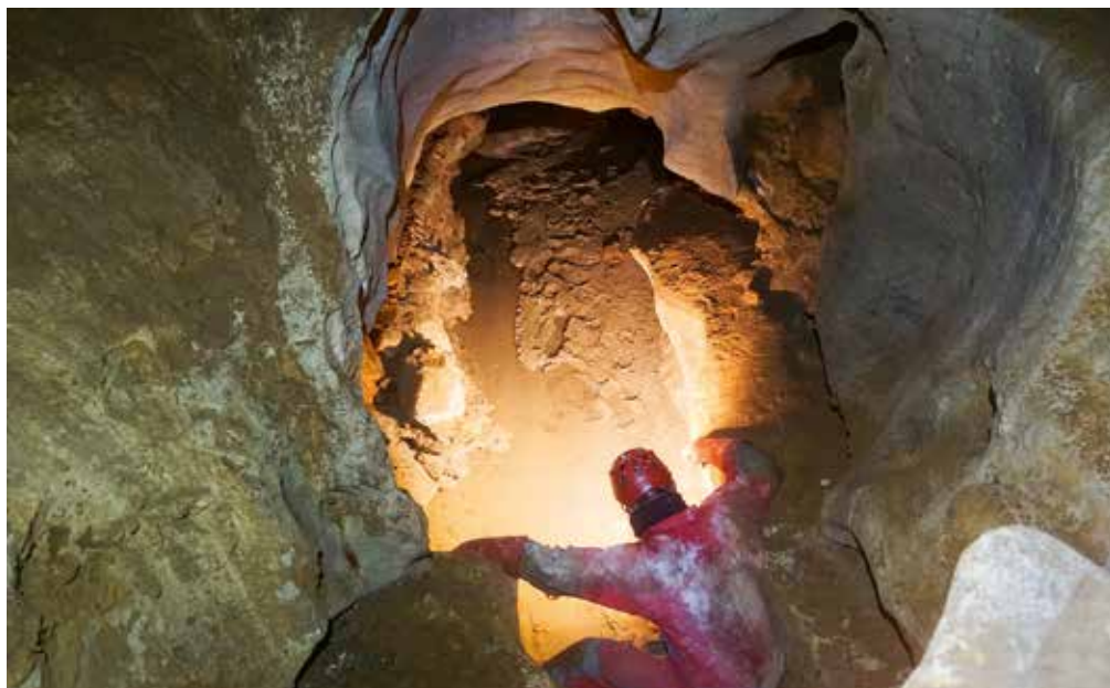
Na globini 65 metrov jamo obogati stalni tok vode.

V Zjoturini smo se razdelili v dve ekipi. Srečko je bil zadolžen za širjenje meandra, v katerega je tudi tokrat močno vleklo. Z Anžetom sva se v popolni bojni opravi, z dvema zelo težkima »prasicama« odpravila v vodni meander. Do brezna sva potrebovala malo več kot eno uro, zaradi otovorjenosti in težavnih prehodov vzdolž meandra. Po spustu v malo več kot 10 metrov globoko brezno naju je pričakal nov vijugast meander, ki pa je bil prehodni. Samo za zadnji del, manjše brezno, sva potrebovala vrvi. Prišla sva v manjšo blatno dvorano, za katero je sledila še ena, v njej jezero, globina vode dobrega pol metra, višina stropa pa največ 1 meter. Kam odteka voda, se ni dalo ugotoviti. In tukaj se je zgodba vodnega meandra zaključila s sifonom. Žal. Ali pa tudi ne, glede na težaven dostop. Meritve so nas na tem delu pripeljale do globine 81 metrov.