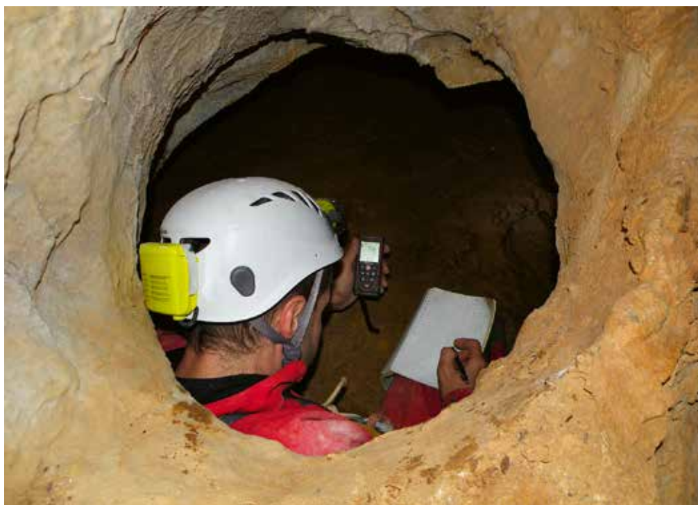
Meritve jame na prehodu v Križišče.

sva imela srečo, kajti v steni nad dnom sta bila videti kar dve možni nadaljevanji. Eno od njiju naju je pripeljalo naprej. Rov manjših dimenzij, v katerega sva se splazila, se je kmalu izkazal kot suhi fosilni vodni rov, katerega smer in dimenzija se je dinamično spreminjala, kar jamarja ne pusti ravnodušnega.