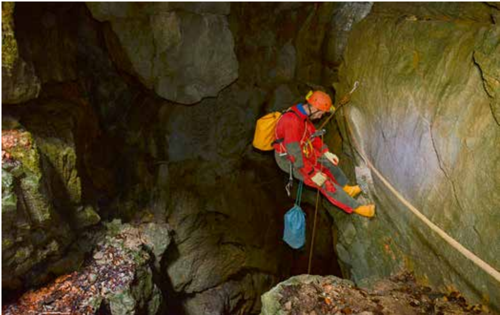
Srečko opremlja vhodno vertikalno.

Vhodni del brezna Zjoturina z globino malo čez 40 metrov ima na dnu relativno velike dimenzije, ki na prvi pogled ne obetajo nadaljevanja – podor in kamenje. Tokrat