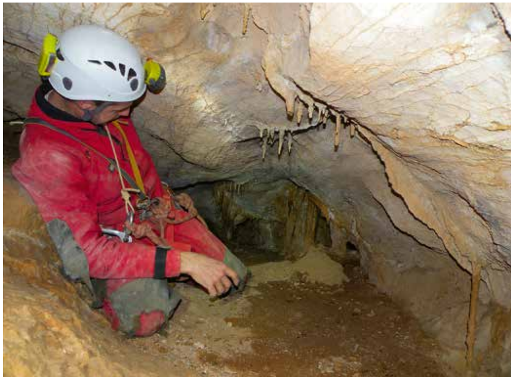
Pred skritim prehodom v nadaljevanje.

Konec decembra smo se Srečko, Anže in jaz znova podali na območje Morave. Prvenstveni namen je bil pregledati stopnjo in brezno, kjer sva se s Srečkom ustavila na predhodni akciji. Pred spustom v Zjoturino smo sklenili, da raziščemo še Zjot 2 (zgornja Ajbikovka), brezno, v katerem nam je na globini 35 metrov zmanjkalo vrvi. Vhod leži okoli 70 metrov višje kot Zjoturina in na prvi pogled deluje mogočnejše. Vhodni stopnji, globoki več kot 20 metrov, je sledila krajša poševnina, prekrita z ostanki debel. Zadnja stopnja se je odpirala v mogočnem breznu, široka 14 metrov, ki je pripeljalo na podorno dno ogromne dvorane z nagnjenim dnom. Najnižji del dvorane je bil močno zasigan z različnimi kapniškimi oblikami. V tem delu je bilo čutiti prepah, kar je razvidno tudi na kapnikih, ki so nepravilnih oblik. Možnost nadaljevanja smo našli na mestu, kjer pa bi bilo treba odstraniti podor, za kar se nismo odločili. Čas nas je preganjal v Zjoturino. Rezultat raziskav Zjota 2 je bil: globina 66 metrov, horizontalna dolžina 72 metrov in dolžina poligona 112 metrov.