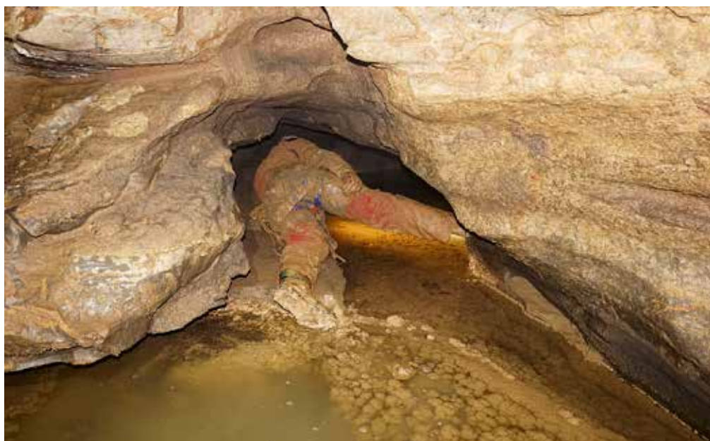
A gremo naprej hrbtno, bočno, ali po trebuhu?