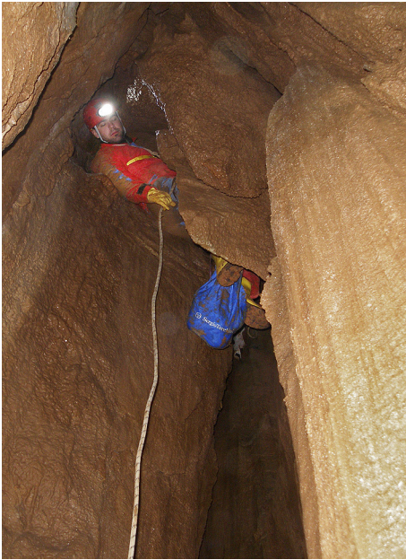
Prehod v novo brezno.

Leto 2008 je bilo v vseh pogledih jamarško nadvse uspešno. Poleg intenzivnih raziskav na Poljanski gori in odkritju najgloblje Dolenjske jame smo bili dejavni tudi v bližini Novega mesta, točneje deset minut vožnje po luknjasti cesti iz Prečne proti vrhu Kamenškega hriba, ki je v bližini Velikega Lipovca. Tu smo raziskali mogočno brezno, ki smo mu nadeli ime Straški mejnik. Upali smo namreč, da se nam bo končno uspelo prebiti do podzemne Temenice, ki s svojim skrivnostnim in nedostopnim tokom že vrsto let buri domišljijo jamarjev. S tem bi postavili nekakšen mejnik dosedanjim raziskavam na tem koncu – in od tu tudi ime jame.