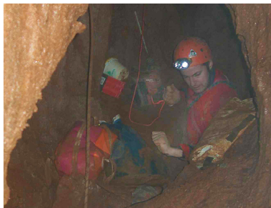
Priprave na širjenje ožine.

leto in pol, da smo se spet navdušili nad jama in dejstvom, da gre jama naprej. Prvo novembrsko nedeljo leta 2008 smo Jernej Tramte, Borut Ponikvar in jaz na pot odrinili že zelo zgodaj. Do že znanih delov v jami je napredovanje potekalo tekoče in brez težav. Te so se začele, ko smo prišli do razširjenega prehoda, pod katerim se je videlo približno 10 m brezna. S seboj smo imeli precej opreme, ki je že tako ozek prehod še dodatno otežila. Za nameček so bili na več mestih nekakšni ostri robovi, tako da smo vsi