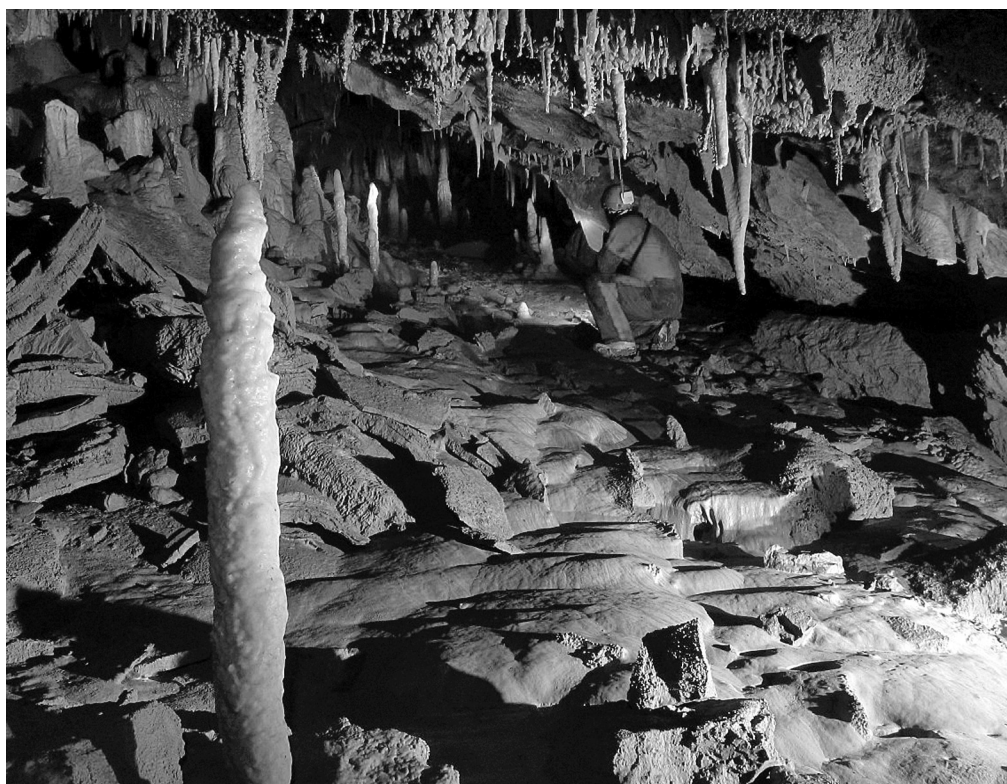
Dolga dvorana: pogled navzgor proti izhodu.