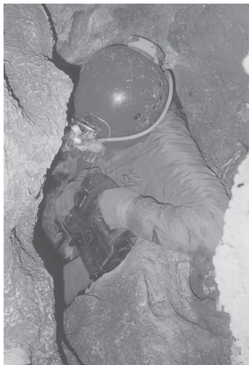
Širjenje ožine v Štirnici.