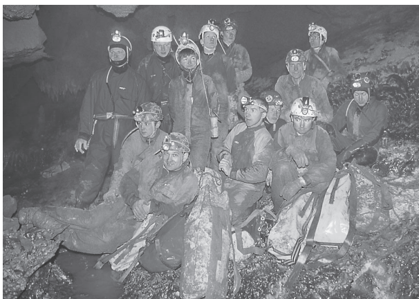
Ekipa “drugega potopa”