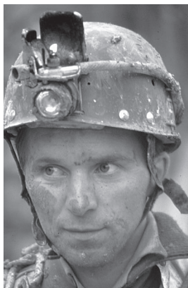
Marko v Bosni, 1989.