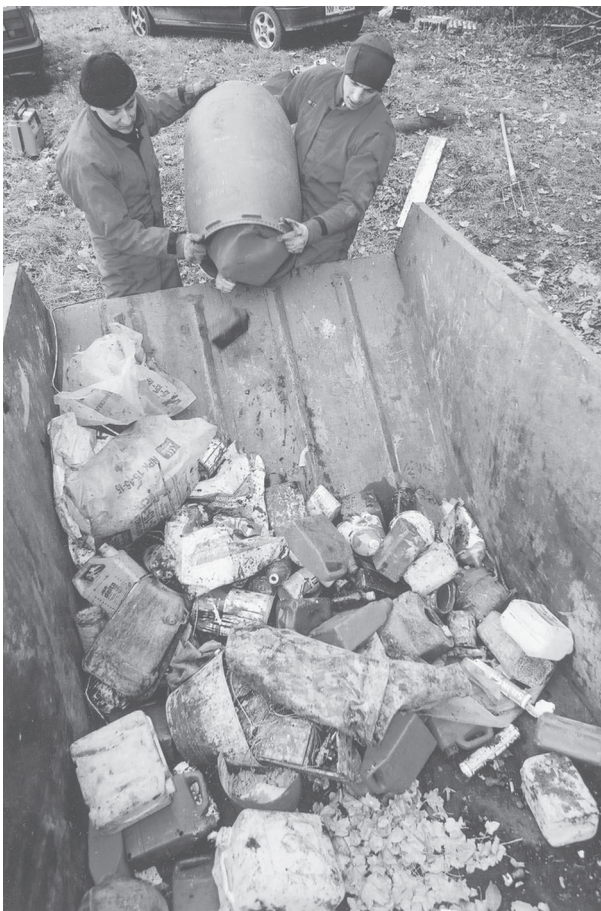
Kaj vse smo našli v jami.

Najbolj neprijetno delo so imeli tisti v jami, ki so morali poleg trdega dela prenašati še različne vonjave. Od kemikalij, naftnih derivatov pa do vonjav razpadajočih ostankov govedi. Tudi tistim, ki so prenašali sode do kontejnerjev, ni bilo z rožicami postlano.