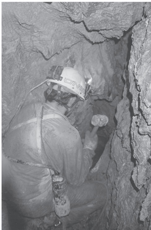
Širjenje ožine pod pasažo Kontrapezo.