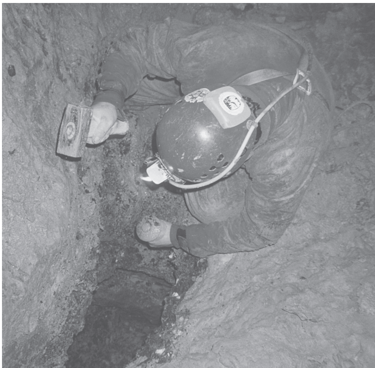
Ali sem že dovolj razširil?