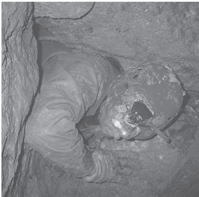
Darko v ožini.

Prebudili smo se malo utrujeni, ne zaradi jame, ampak zaradi manjšega nočnega proslavljanja pred šotori, ker jama "leti" še naprej; nekateri skeptiki pa so odšli domov. V jamo smo se odpravili z novimi vrvmi in merilnim kompletom. Odšel sem zadnji v jamo, da bi prečil Možato brezno. S sabo sem vzel le ročni opremljevalni komplet. Po mučnem odletavanju nazaj v vertikalno ter zabijanju svedrovcev, mi je le uspelo prečiti brezno v dolžini