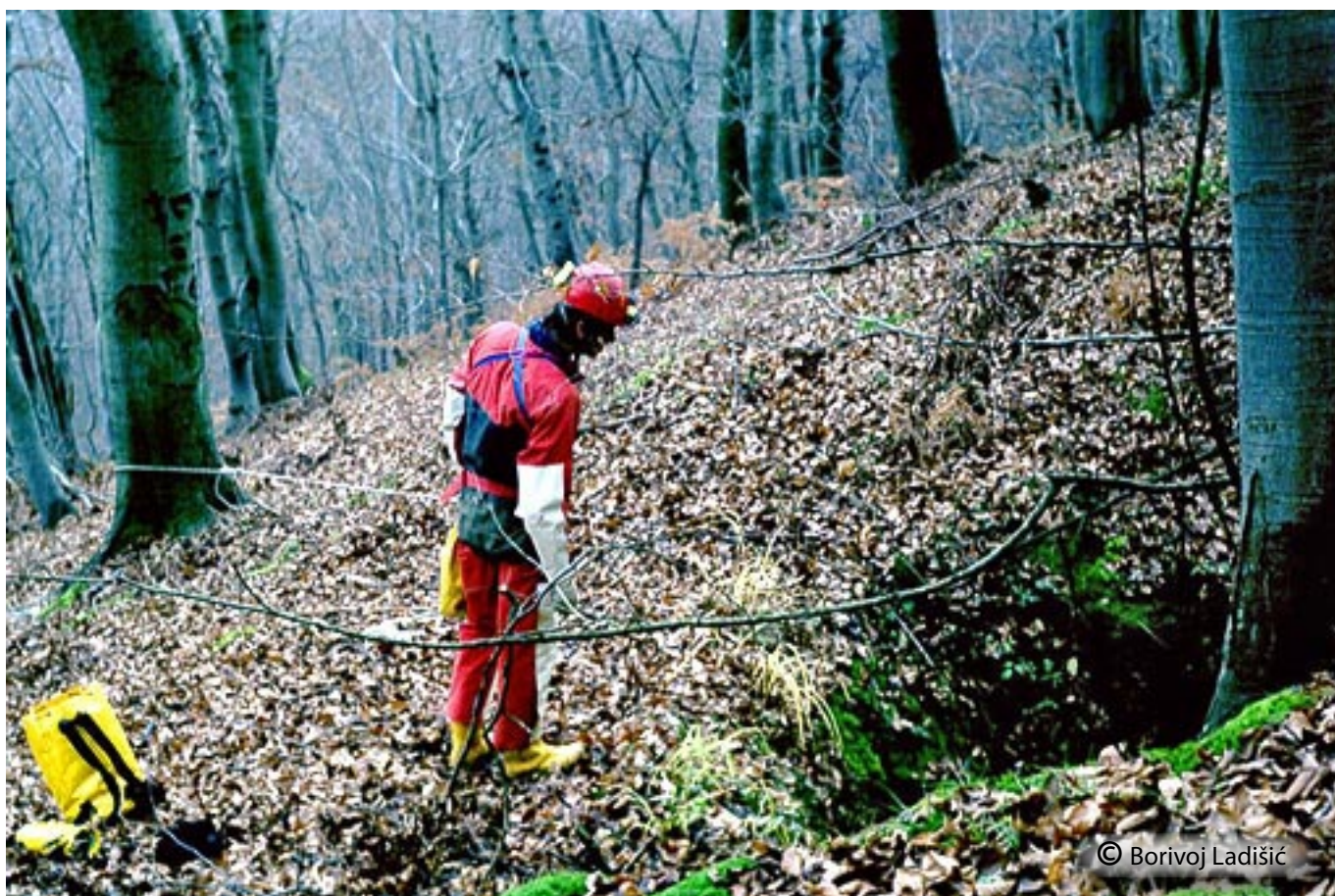
Vhod v brezno.