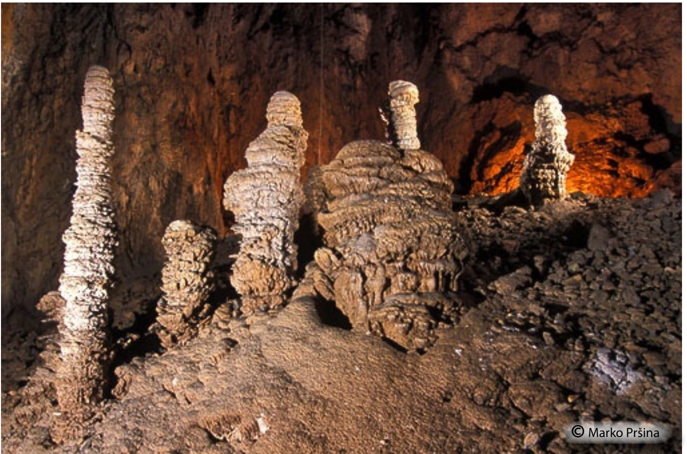
Kapniško okrasje najlepšega brezna na Kočevskem rogu.