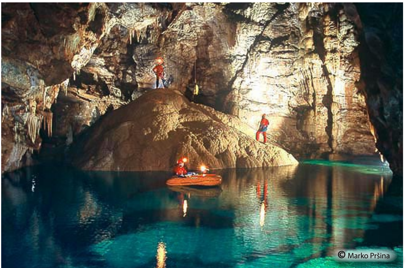
Kapniška zavesa v steni nad Vančevim jezerom.