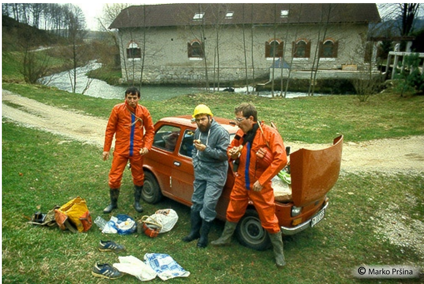
Pred vstopom v obe jami klevevskega jamskega sistema. V ozadju nekdanji mlin ob Radulji.