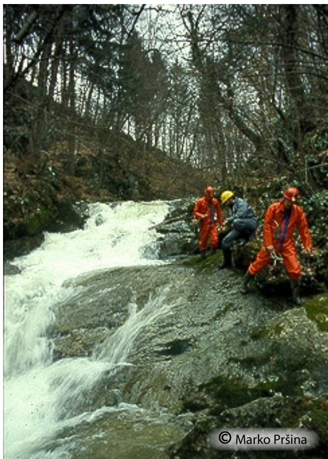
Dostop do Zgornje Klevevske jame je skozi slikovito sotesko Radulje.