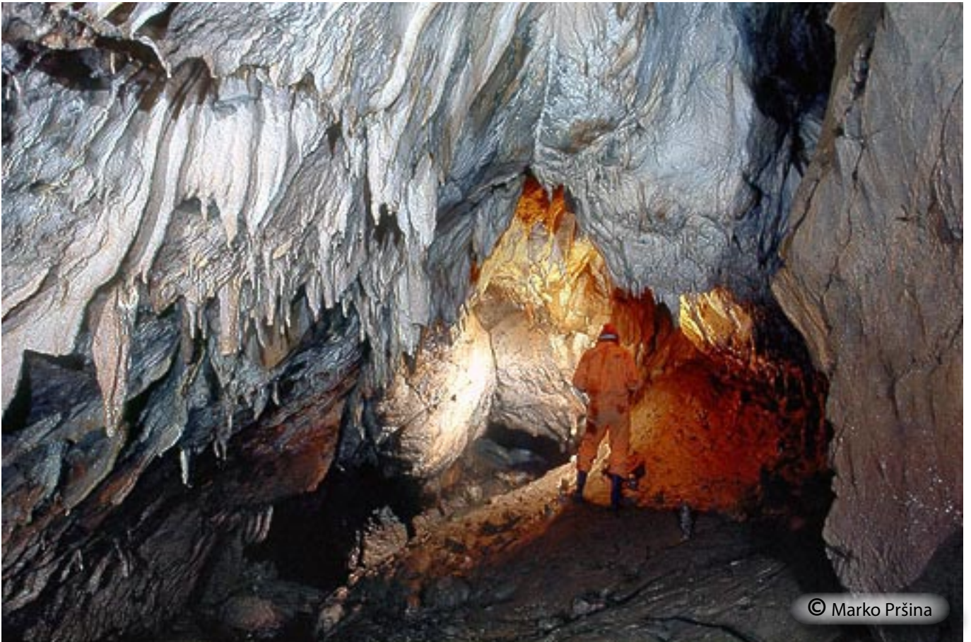
Osrednji, 50 m dolg kapniški rov - v njegovem končnem delu je sifon.