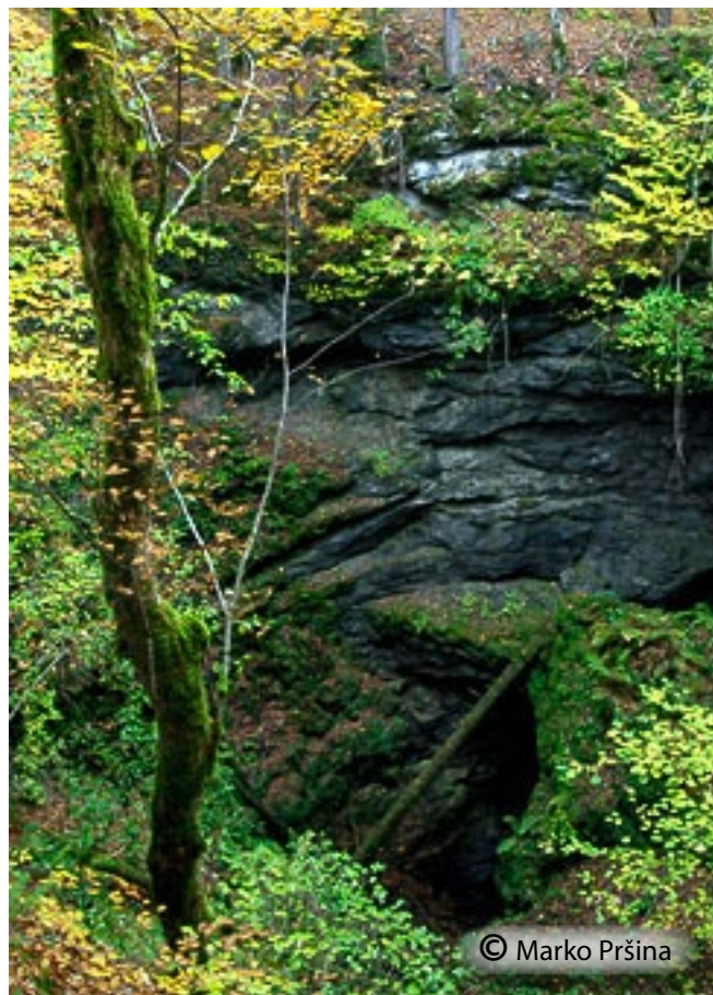
Previsne stene udornice.