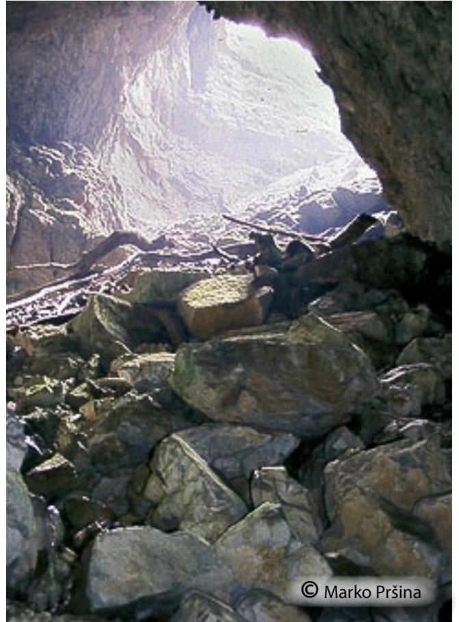
Vhod v udorno jamo vodi po strmem podoru.