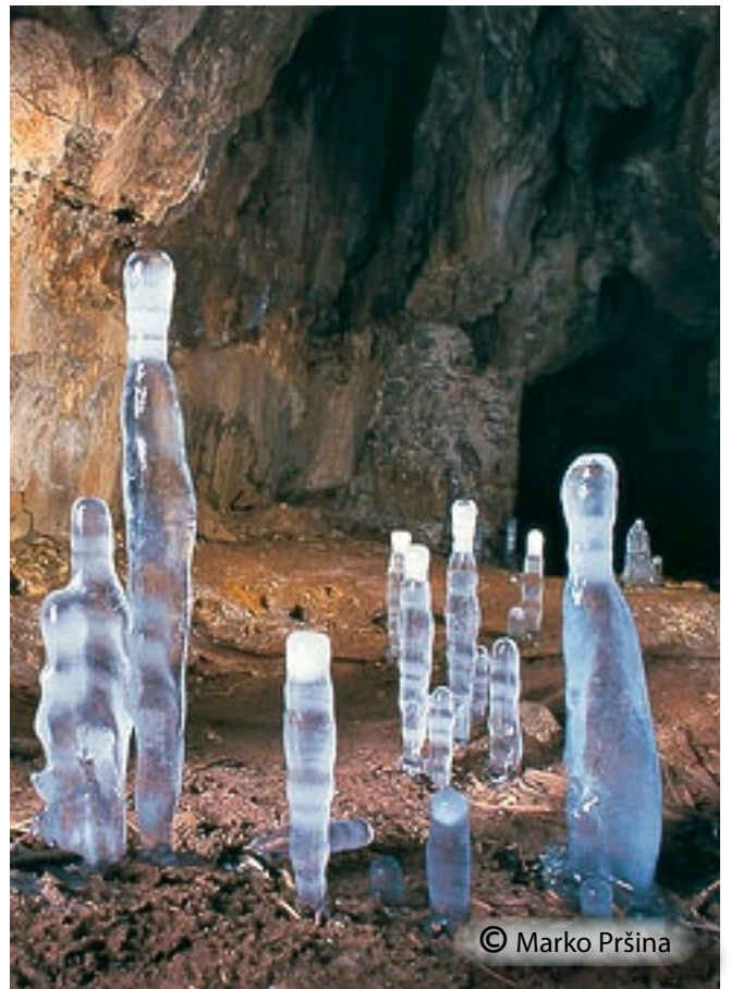
V hladnih zimah v vhodnem delu nastanejo ledeni kapniki.