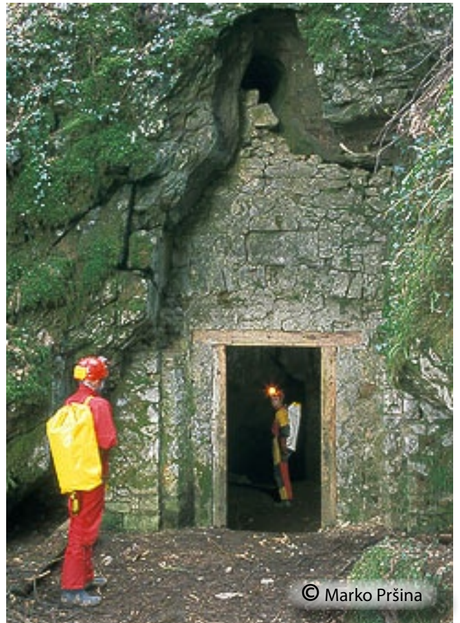
Vhod je zazidan. Do nedavnega je bil zaprt z vrati.