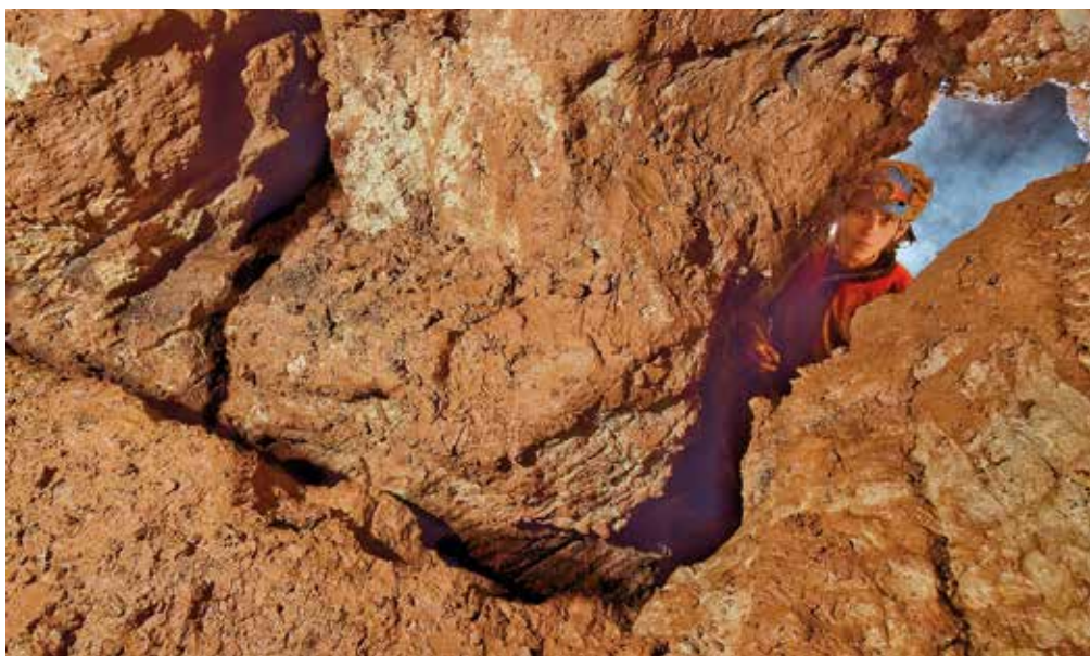
Težko, vlažno, mrzlo blato – vse to je ilovica.