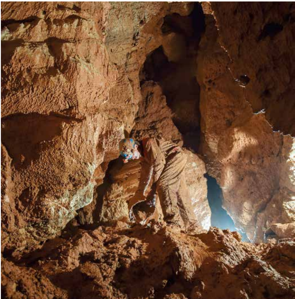
Premetavanje ilovice v Podorni dvorani razočaranj.