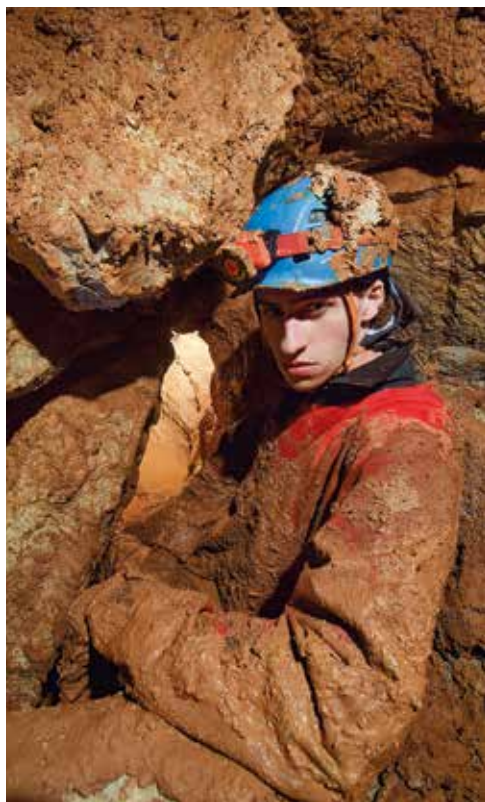
Ozek prehod do jezercica.