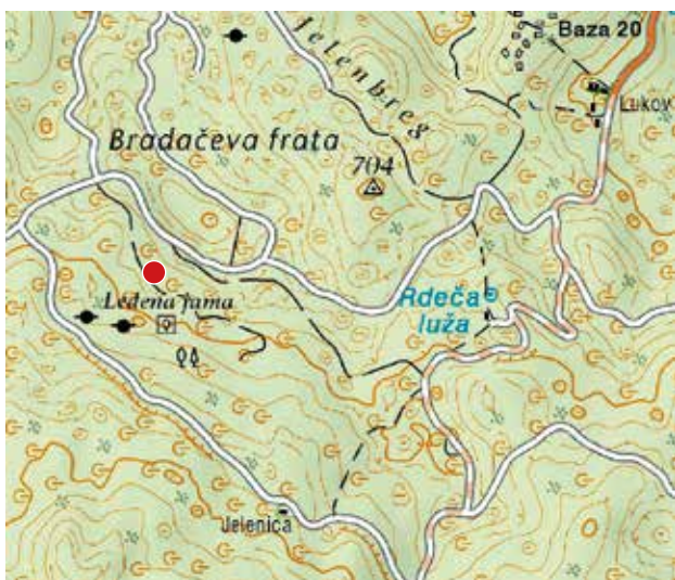
Lega brezna na topografskem zemljevidu.

Vhod v 21 m globoko in 35 m dolgo brezno leži na območju med Bradačevo frato in Jeleniško cesto v osrednjem delu Kočevskega Roga in je približno 150 m oddaljeno od partizanske bolnice Stari Log in njenega bližnjega grobišča, po kateri je brezno tudi dobilo ime. Vhod, velik 1,5 x 1,5 m, je tik ob vlaki na močno zakraselem in z gozdom poraščenem območju. Vhodno brezno se zvonasto razširi in je globoko 14 m. V steni nad dnom je ožina, ki smo jo razširili, za njo sta kratek rov in lepo zasigana kamrica. Na robu se odpira ozek vhod v 10 m globoko brezno, ki se na globini 21 m konča brez nadaljevanja.