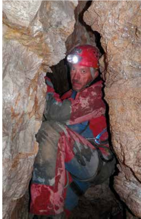
Le kaj je meni tega treba?

Resnejši pristop se je začel leta 2014, čemur je botroval splet naključij. V tem letu smo v načrt raziskovanj vključili dva druga objekta: NM 9 in NM 97. V njih smo naleteli na nepremostljive težave, zato smo predzadnji dan tabora vse sile namenili Kremenčku. Da ne bi izgubili volje že na začetku, smo najprej na bolj prijazno dimenzijo razširili vhodni del. V nadaljevanju smo se na dnu prvega brezna lotili vijugastega meandra. V šestih urah sva z Andrejem nekako uspela izboljšati prehodnost 6 m dolgega meandra. V nadaljnjih letih smo ga dodatno razširili in prišli do manjše odprtine, ki se je pozneje izkazala kot prehod v nove dele. Na takratni akciji pa nama jo je zaradi praznega akumulatorja uspelo razširiti le toliko, da sva skozenj pomolila glavo in občudovala temo pod njo. S pomočjo jamskega globinmera sva grobo ocenila, da kamen pade tam nekje med 40 in 50 m.