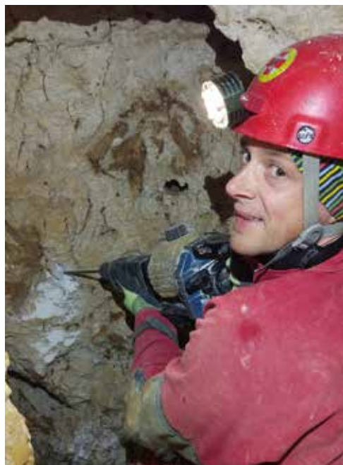
... Mič pa z desne.

Še najbolj svetla točka je bila fotografija aragonita, ki jo je ovekovečil Mihael, odlična kulinarika v zveznem bivaku, aha, pa dobro smo se tudi imeli. V Živi jebi smo tako vztrajali še dve izmeni in bili po svoje veseli, da se tabor počasi zaključuje. Dosežena globina 98 m pa nekaj le je. Za novih 10 m smo porabili 50 ur dela in naredili več kot 100 izvrtin.