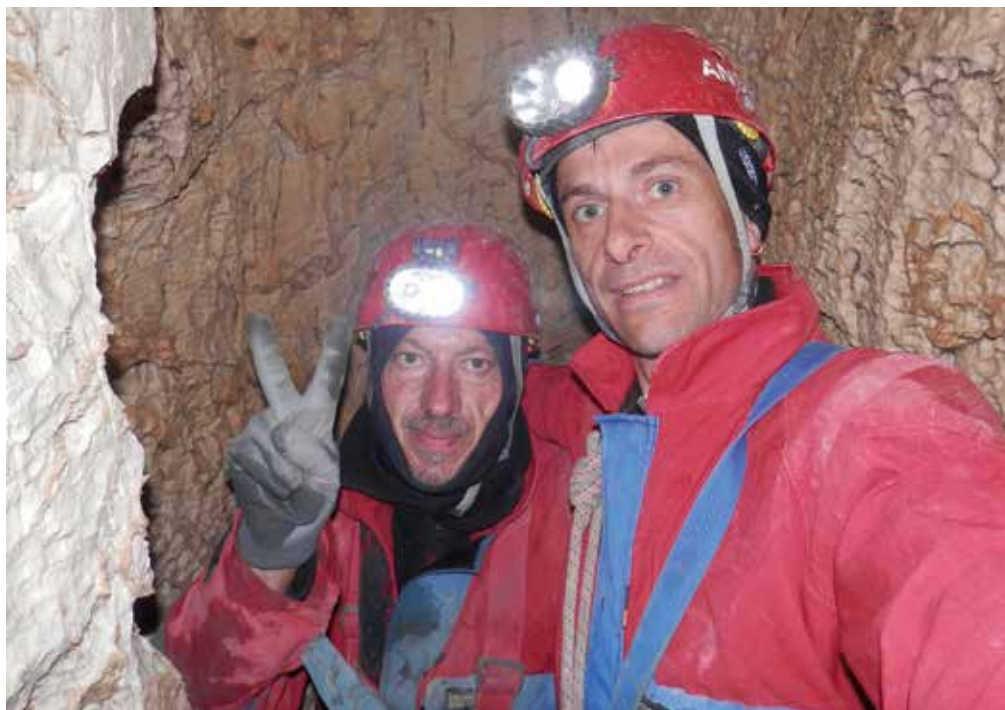
Nasvidenje do naslednjic.

»Kremenček, hvala ti, da si me po nekajletnem premoru raziskovanja kaninskega pogorja povlekel v svoje globine in mi omogočil izjemna jamarska druženja in doživetja.