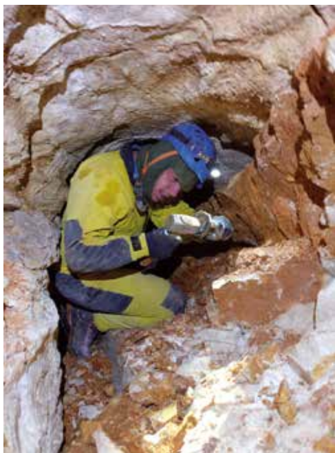
Žekar ga napada z leve ...