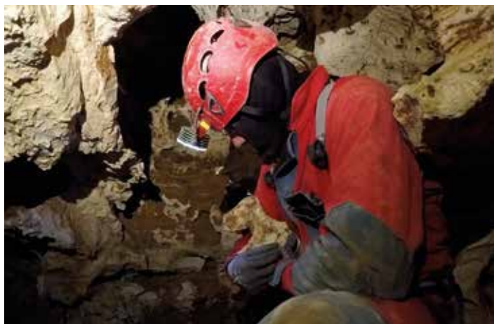
Moj, moj Reksi.

Upanja in pričakovanja v letu 2018 so bila velika, predvsem zaradi močnega prepriha, na katerega smo naleti v preteklem letu, izginjajoče vode, dveh meandrov in dveh možnih nadaljevanj. Tokratno širjenje je začela »pomlajena« ekipa pod budnim očesom Anžeta. Širili so meander, ki je dobil ime Reksijev prehod, na tem mestu sem namreč pred letom našel kamnito skulpturo živali in jo poimenoval »Reksi«. Po nekaj urah jih