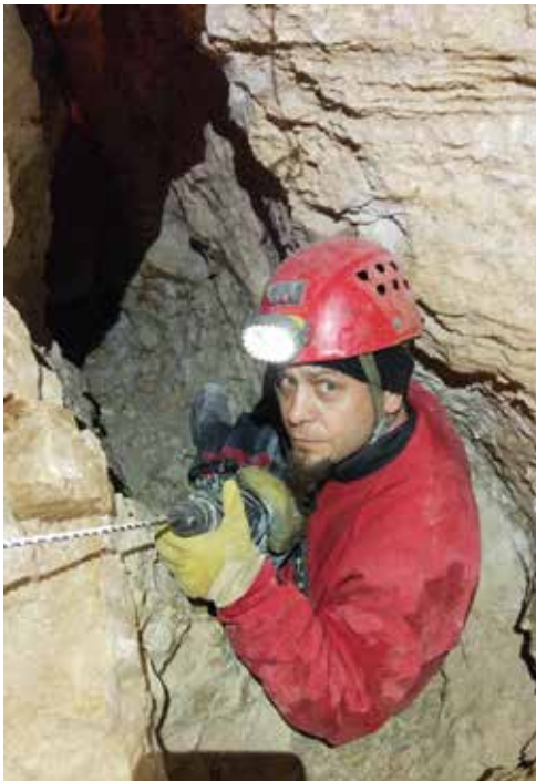
Jaz vrтам, ti vrtaš, on vrta...