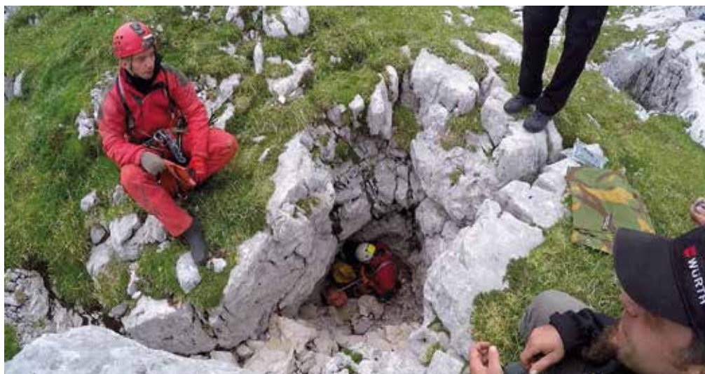
Konstruktivna debata pred akcijo na vhodu v brezno.