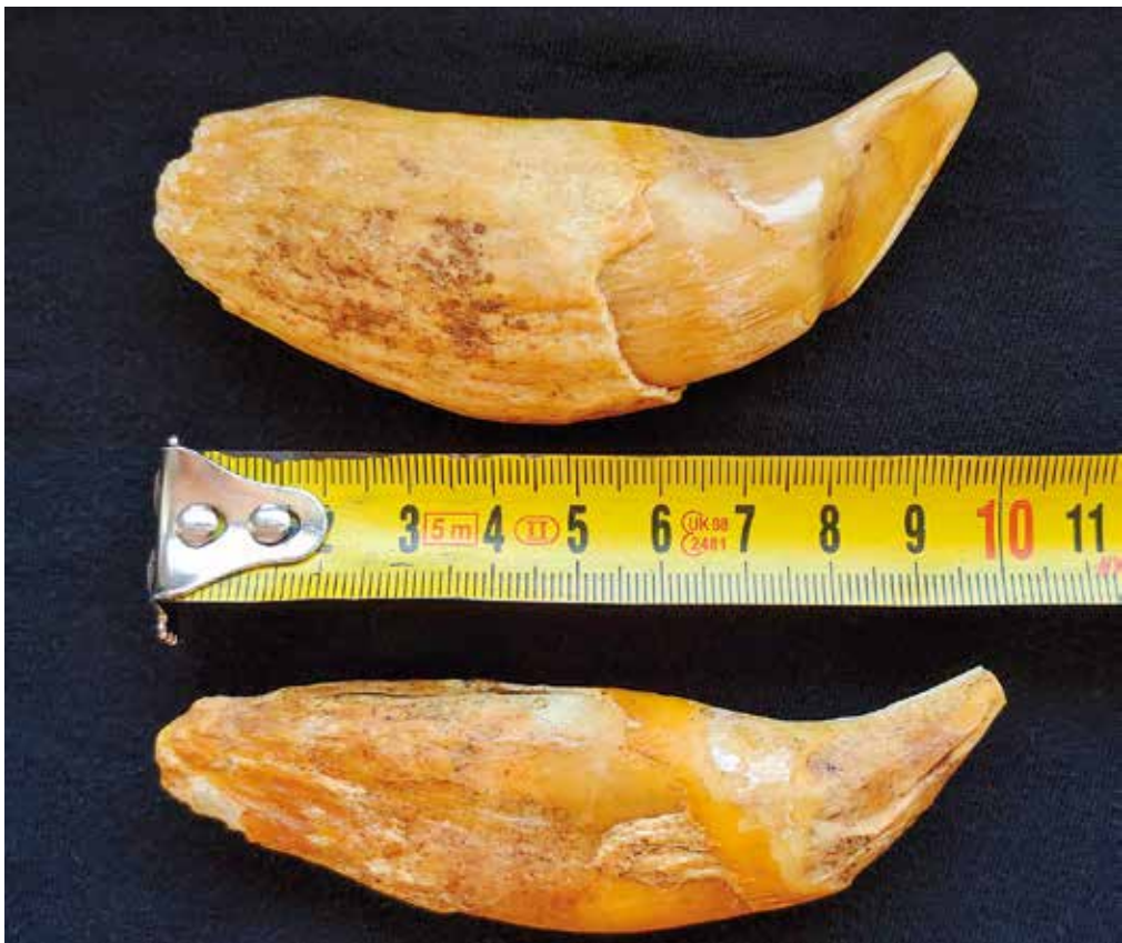
Podočnika (kanina) jamskega medveda v naravni velikosti.

Ko potegnemo črto, lahko ugotovimo, da ima Kaco res pravi nos za jamsko raziskovanje. Zasigano odprtino, skozi katero ni šla niti pest odraslega človeka, smo razširili v prehod do novega dela jame, v katerem smo našli do sedaj edino najdišče jamskega medveda na Poljanski gori. Vsekakor jama, v katero se spleča pripeljati še koga, ki ga zanima podzemni svet in nima težav s prebijanjem skozi ožino.