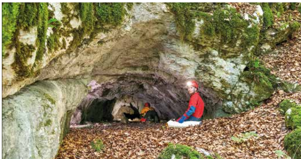
Vhodni deli jame so povsem vodoravni.