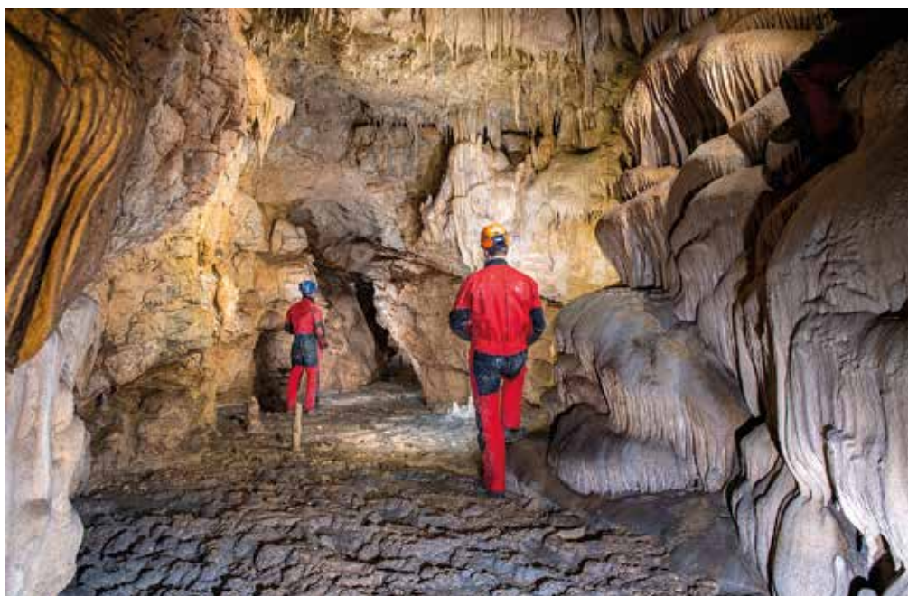
Dno dvorane za Prebojem zaznamujejo debeli nanosi blata.

Ko sva prišla do jame oziroma omenjene odprtine, sem Kacota pogledal kar malo postrani, češ, kam me je spet to pripeljal. V najini navadi je namreč, da se prebija tam skozi, kjer drugi obupajo. In tokrat je bilo videti zares ozko! Splazil sem se po trebuhu do konca in poslušal navodila, naj zavpijem proti luknjici. Priznam, odmev je bilo res prijetno slišati, vseeno pa se zaradi tega ni nič lažje delalo. Če sva si želela delovišče narediti prijaznejše, sva se seveda morala vrniti nekaj metrov nazaj in sva začela razbijati skale v nemogočem položaju, na trebuhu, v eni roki špica, v drugi macola, idealno! Po nekajurnem rudarjenju sva ugotovila, da preboja ta dan še ne bo, Kaco pa je zatrjeval, da v nadaljevanju že vidi manjšo dvorano.