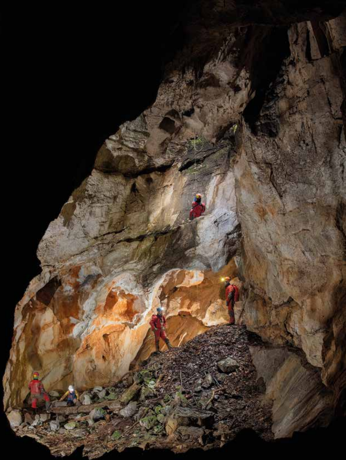
Spust v vhodno vertikalno.