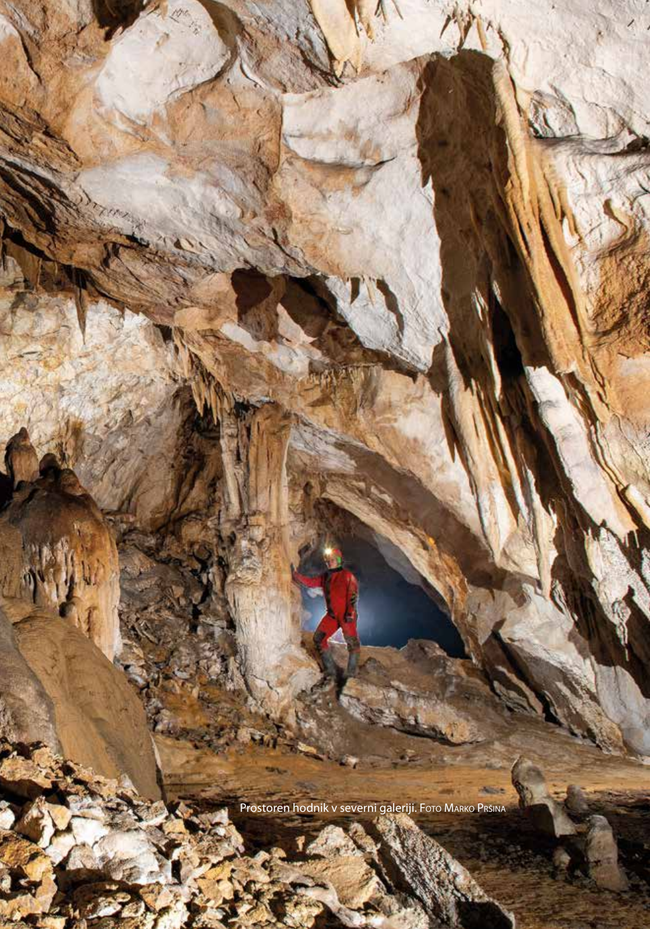
Prostori hodnik v severni galeriji.