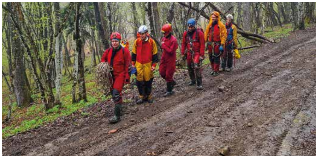
Blatna je pot do lepotice Kasiopeje.