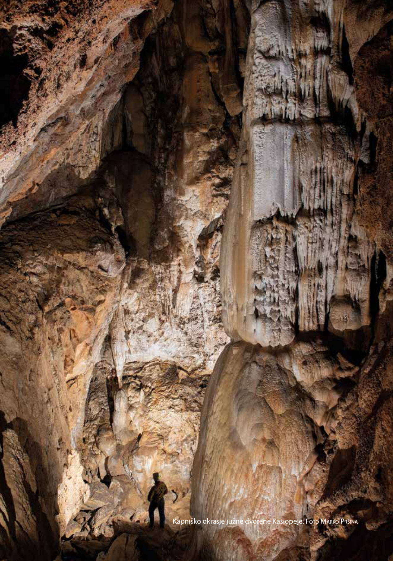
Kapniško okrasje južne dvorane Kasiopeje.