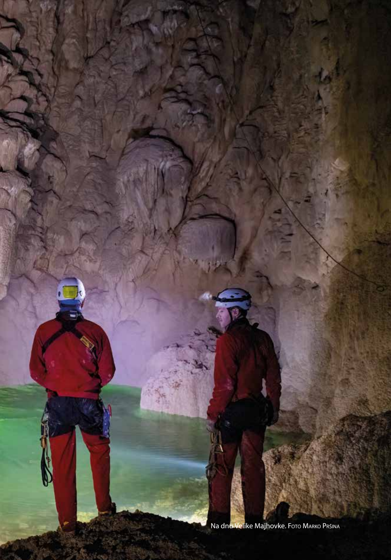
Na dnu Velike Majhovke.