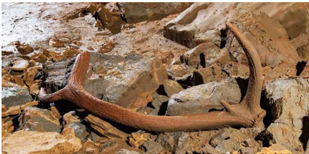
Jelenov rog je ležal na vrhu podornega kamenja, ki prekriva jamsko dno.

Ne vem, zakaj je deloval tako hladno, verjetno je v svoji jamarski zgodovini že marsikaj videl, zato je bil toliko manj vznemirjen. Sam sem bil toliko bolj presenečen, ko sem priplezal do njega in ugledal v nadaljevanju pravi hodnik, ki mu ni bilo videti konca. Sprehodila sva se in bila iz koraka v korak bolj vesela in željna, da se to ne bi končalo, pa je bilo po okoli 70 m konec vidnega nadaljevanja. Tam sva na dnu opazila kapitalen jelenov rog in se začudeno zazrla v strop. Po nekaj metrih je bilo v kamninu opaziti zagozdeno ogromno skalo, ki je kot kaže prekrila brezno, skozi katerega je nekoč padel omenjeni rog.