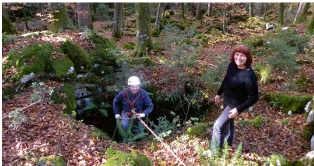
Vhod v brezno. V dolini je lokacija bolnice.