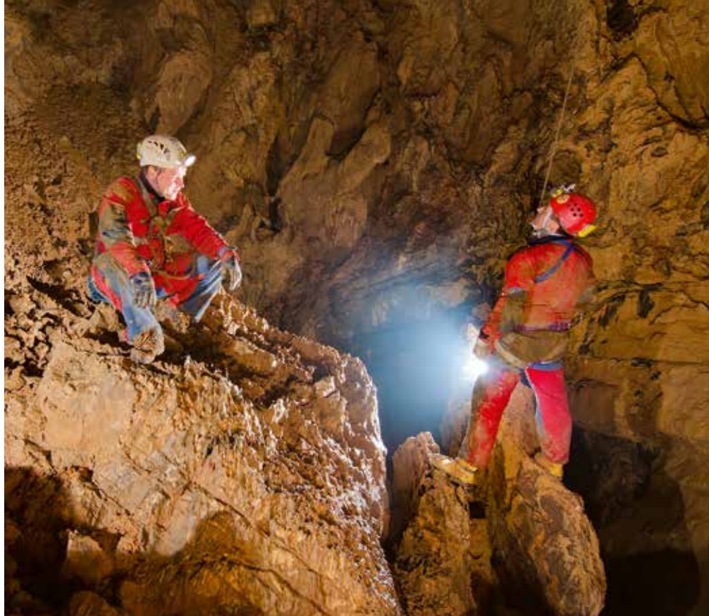
Na blokih v podorni dvorani.