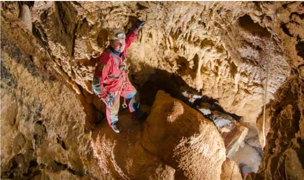
Velika sigova kopa na globini 53 metrov.

Napočil je torej težko pričakovan trenutek, ko sem naposled vstopil v nedrje moje sanjske jame in občutil tisti nezemeljski občutek, ko te v objemu teme zagrabi gravitacija in ti okoli ušes zaveje mrzel piš. Res nepozabno doživetje. Bingljati na tanki vrvi, kot pajek na nitki, noge pa otepajo v prazno. Po spustu v brezno smo ugotovili, da ima obetavno nadaljevanje, vendar preozko za prehod. Vrnili smo se čez en teden