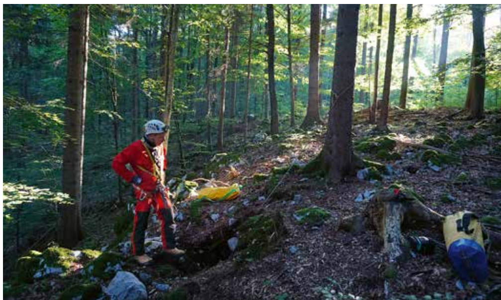
Vhod v Kofelco.

Na majhen vhod, pravzaprav polšno, sem postal pozoren med jutranjim sprehodom po gozdu. Na prvi pogled nič posebnega, a ko se mi je iz dlani odkotalil kamen, sem se zdrznil. Kar sem slišal, je delovalo zelo globoko. Odmaknil sem nekaj kamnov, ki so zastirali pogled v notranjost. Ni bilo dovolj, zato sem se bolje pripravljen vrnil naslednji dan in se lotil težaškega odpiranja preozkega vhoda. Za silo je postalo prehodno, a zares šele 22. avgusta, ko sem odstranil še zadnjo oviro in se podal neznanemu naproti. Lepo zasigane stopnje so se nizale druga za drugo vse do globine 43 metrov, kjer je