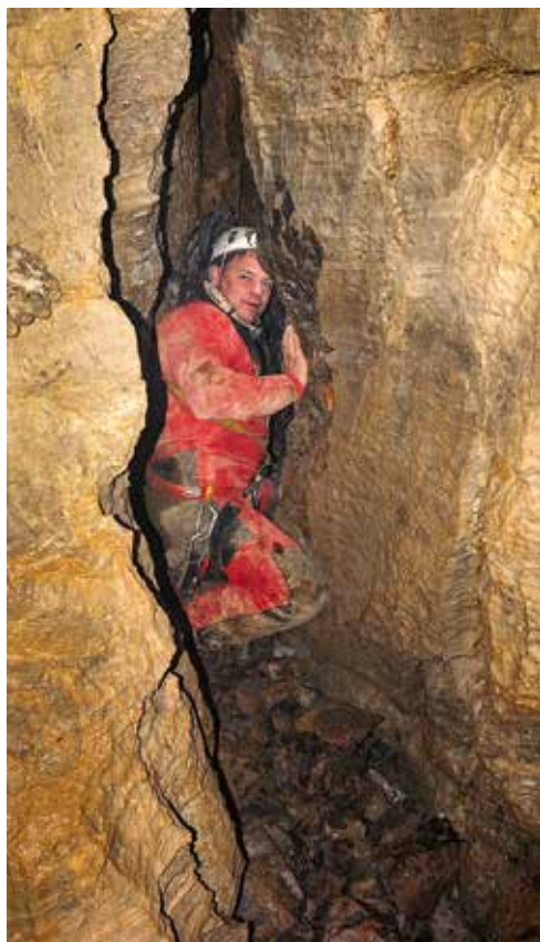
Napredovanje v meandru.

Vrnila sva se že čez štiri dni, kajti nova perspektivna lepota je vlekla z mikavnostjo in sredi septembra sva že tolkla po mokri in trdoživi kamniti gmoti. Poznalo se je, da je bil v obdobju teh štirih dni dež in v jami je kar konkretno pralo. Malo sva stisnila zobe ter se premočena in že nekoliko prezebla po kaki uri ali dveh le prebila naprej. Spustila sva se 5 metrov v nekakšno blatno in krušljivo kamnico, ki je bila pravo nasprotje do tedaj krasno zasigane in lepe jame. Tu nekako kar nisva več vedela, kako in kam naprej. Vse je bilo razbito in nestabilno, kjer si kamen samo narobe pogledal in se je že grozeče zamajal. Srečko se je zastrmel v neko okno ter obmolknil, jaz pa ravno tako in si v tisti čudni tišini enega prižgal. Prijatelj je še vedno strmel v tisto okno in nekaj metal skozi, potem pa nenadoma planil kvišku. »A si slišal?« je izstrelil. Začudeno sem ga pogledal z velikim vprašajem nad glavo. Slišal nisem nič, še manj pa videl, zato je vajo ponovil. Vzel je večji kamen in ga zalučal v zdaj že locirano smer pod