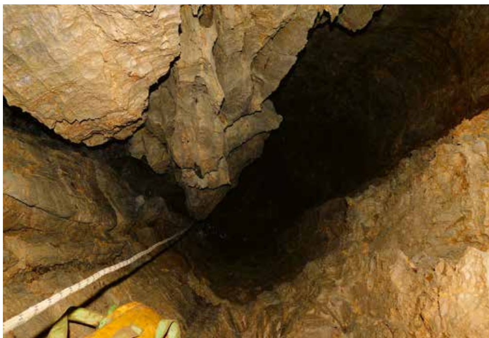
Proti dnu brezna Harry Potter.

pravim kotom. Kamen se je enkrat odbil, potem pa je bilo vse tiho. Že sem hotel seči po novem čiku, ko je nekje globoko spodaj zabobnelo. Na čik sem seveda nemudoma pozabil in poletel k oknu še jaz, kajti temu, kar sem slišal, se enostavno nisem mogel upreti. Srečko se je medtem že zrinil skozi ožino in huronsko zatulil, jaz pa trenutek pozneje prav tako, navkljub nekaj kilogramom več in dodal še svoj bojni krik.