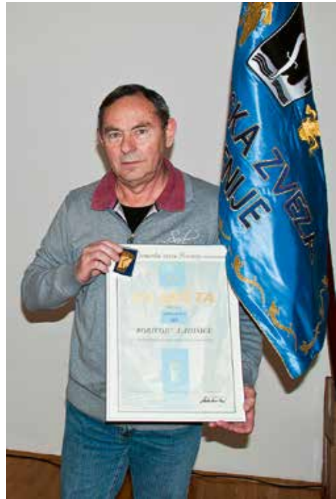
Ob podelitve zlatega znaka Jamarske zveze Slovenije v Topolščici, 19. marec 2016.

Najuspešnejši odkritelji novih jam v zgodovini (upoštevani so vpisi v rubriki »zapisnikar« v bazi Katastra jam 2016b)