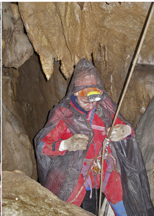
Priprave za spust.