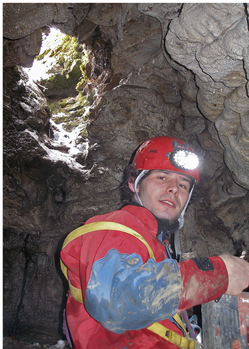
Pod vhodom.

Naslednji vikend sva s Srečkom opustila raziskovanje zaradi prevelike količine vode, kajti ob taljenju snega se je povečal meteorni pritok. Vseeno sva se spustila do dna brezna in uživala v slapu, kajti v jamah na našem koncu zelo redko doživiš kaj podobnega. Naslednjo nedeljo smo bili močno presenečeni, ko smo končno razširili razpoko in se po slapu spustili do dna dvorane na globini 49 metrov. Logično je pričakovati, če voda v dvorano priteka, da tudi odteka v vsaj majhen meander ali razpokico. Mi pa smo se na dnu zmedeno ozirali naokoli, kot da smo kaj izgubili, in še danes nam ni jasno, kam voda odteka. Mogoče se bodo s časom odprle možnosti, zato v prihodnosti načrtujemo vnovične preglede, kajti domnevam, da jama v ozadju skriva tisto, kar kažejo njene značilnosti v raziskanem delu.