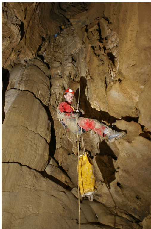
V zadnji vertikali.

drobni špageti belih barv, na tleh čista lesketajoča siga bele barve. Midva pa vsa umazana in z blatnimi škornji. Kaj zdaj? Bila sva že v dilemi ali se naj sezujeva in stopicava bosa, a sva si premislila in se odločila, da najprej pogledava, kako kaže za naprej, potem bova občudovala kapniško okrasje. Prostor, ki naju je obdajal in je zaradi nešteti, drobnih lesketajočih se stalaktitov spominjal na planetarij, se je na enem koncu prevesil navzdol v obliki dveh kratkih stopenj. Napredovala sva počasi, previdno, brez vrvi. Ta tudi ni bila potrebna, saj je bila konfiguracija prostora s številnimi čudovitimi kapniki takšna, da je omogočala varen spust med belimi tisočletnimi orjaki. Jama je bila iz metra v meter lepša in kar nisva mogla verjeti, da še