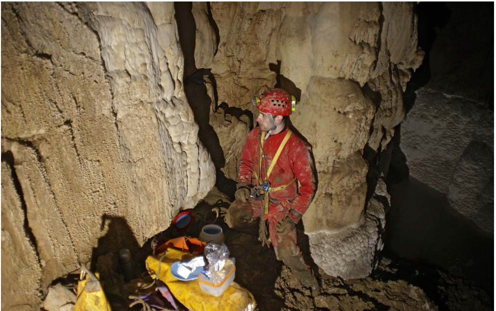
Jama ima bogato kapniško okrasje.