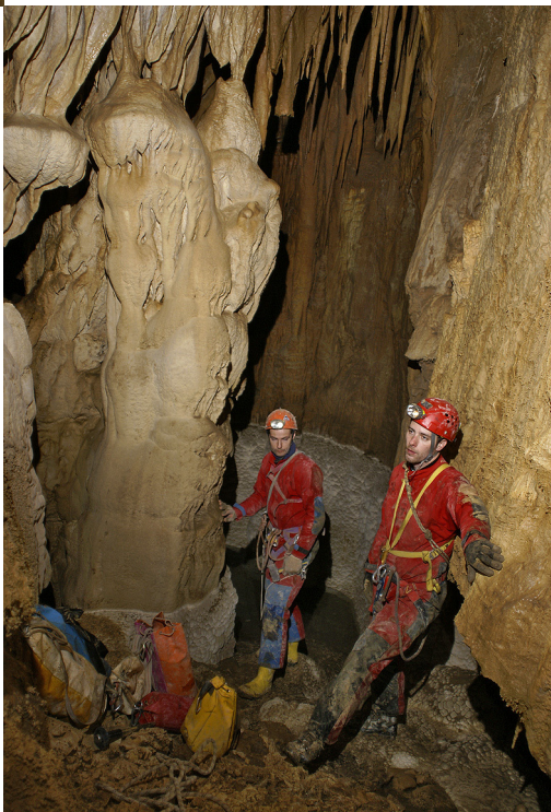
Pri zadnjem jezeru (- 90 m).

natanko 40 m. Začeli smo se razgledovati po dnu prostorne dvorane in iskati morebitno nadaljevanje. Vse špranje so bile zabite s podorom razen ene, kjer se je med podornimi bloki videlo nekaj metrov nadaljevanja. Vse skupaj ni delovalo pretirano obetajoče, a smo se kljub temu odločili, da se v najkrajšem možnem času vrnemo. Z Gregorjem sva se vrnila šele čez štirinajst dni, saj je v tem času zapadlo kar nekaj snega in je bil dostop do jame onemogočen. Podor v ožini, ki nas je zaustavil na prejšnji akciji, sva hitro premetala in se po nekakšnem zasiganem, delno blatnem toboganu poševno spustila meter ali dva niže. Tu pa sva obstala kot vkopana. Prostor, v katerem sva se znašla, je bil prečudovit. Kot bi obrnil nov list v knjigi, ki s predhodnim nima popolnoma nobene zveze. S stropa so viseli