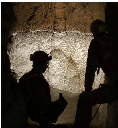
Jamarski silhueti.

obstajajo tako lepe, deviško čiste jame. Po grobi oceni sva že morala preseči globino 50 m. S seboj nisva vzela dodatne vrvi, ker sva načrtovala le razširiti ožino. Ko sva tako stala sredi kapniškega gozda in mrzlično iskala nadaljevanje, ki ga naenkrat ni bilo več videti, sem v enem koncu dvorane vtaknil glavo med sigaste balvane in na glas zavpil. Močno je zadonelo, kar je dalo slutiti, da se zadaj skriva nekaj velikega. Z Gregorjem sva se s težavo zrinila skozi mali kapniški labirint in nenadoma obstala nad praznino. Kako so to lepi občutki, ko dosežeš točko, pod katero je ena sama velika tema. Čepela sva tam in metala kamenčke v globino. Ti so po dveh, treh sekundah padli v vodo.