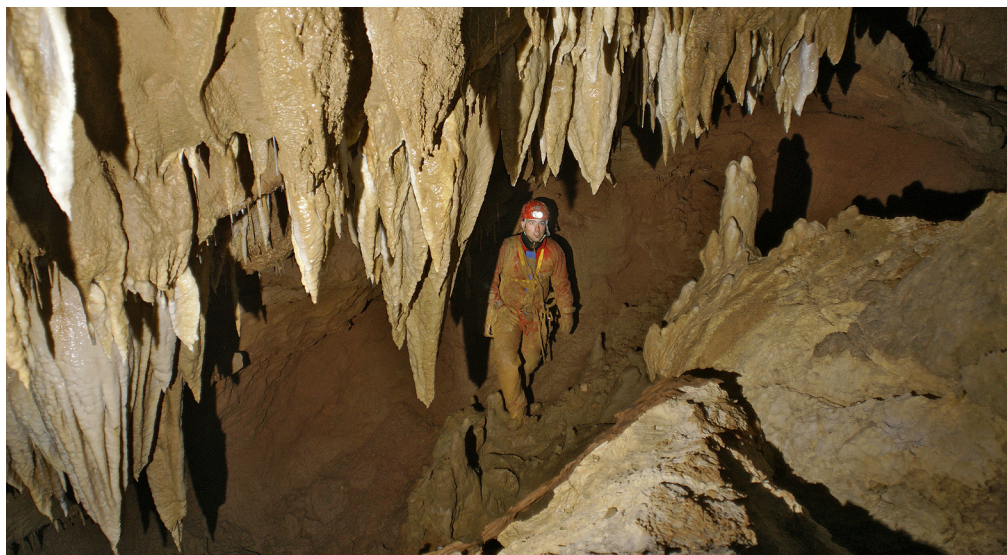
Motiv iz podorne dvorane na globini 130 m.