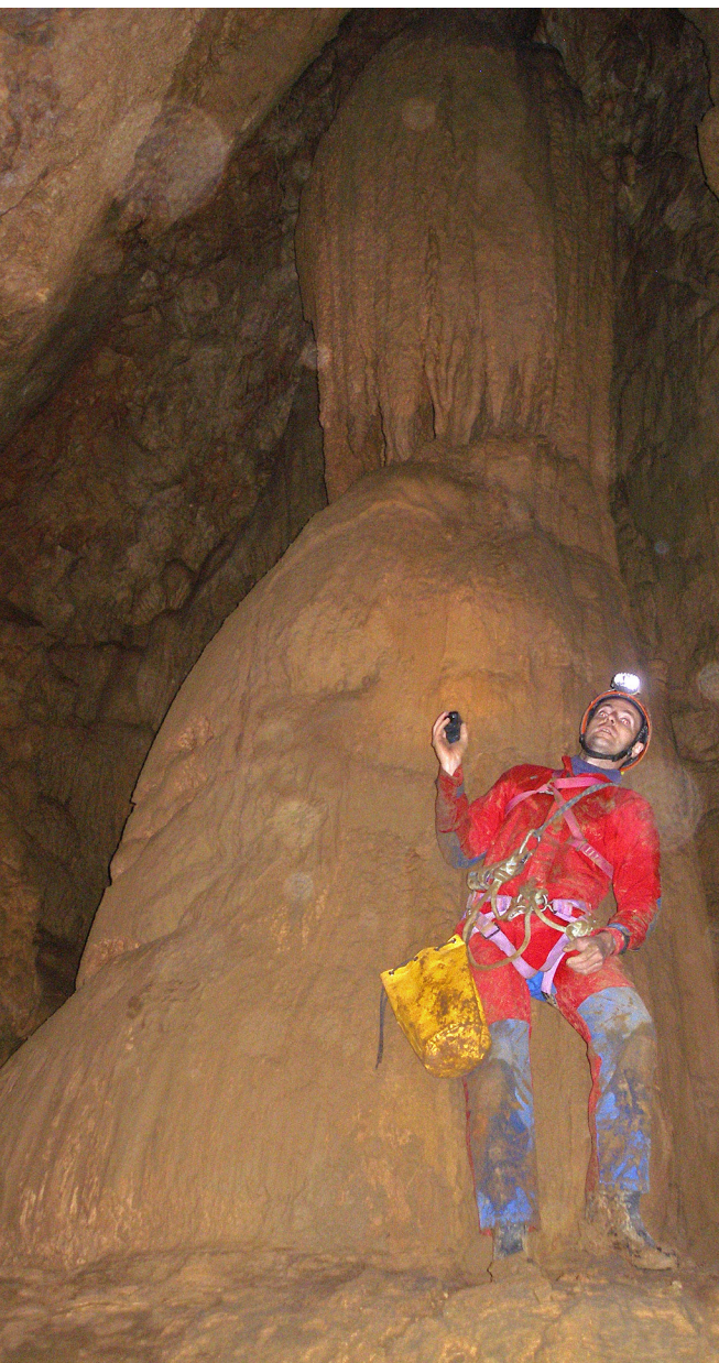
Kopa v kapniški Veliki dvorani.

majhen vhod še zožila. Nekako sem uspel doseči zlomljen konec palice in ga potegniti ven, takrat pa sem začutil prepih! K pravkar očiščenemu vhodu sem prislonil uho in ustavil dihanje. Za trenutek se mi je zdelo, da slišim nekakšno šumenje. Ah, to je šumenje listja v vetru, sem si mislil in še enkrat približal glavo k tlom. Spet sem slišal oddaljeno šumenje in se prepričal, da je tokrat listje na drevesu mirovalo. Gregor je hitro našel droben kamenček. Spet smo zajeli sapo. Kamenček se je odlepil z Gregorjeve roke in se odkotalil v globino. Prisluhnilo smo. Nič. Ali sploh ni padel v globino ali