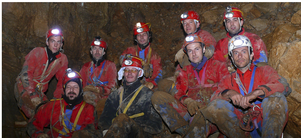
Skupinska na dnu Game over.

Zavedali smo se, da razvejan jamski poligon na več koncih ponuja več možnih nadaljevanj in z raziskovanji nismo nehali, najbolj obetajoče je bilo gotovo v sistemu brezen Stanka Klepca, kjer smo že dosegli 232 metrov globine. Zaustavila nas je ožina, za katero močno doni in odmeva, kar nakazuje na večje prostore v ozadju. Ne bomo odnehali, kajti Čaganka zagotovo skriva še marsikaj!