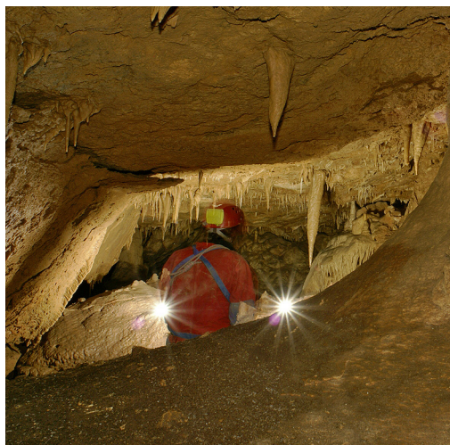
Dvorana netopirjev.

Naslednji teden sva se v jamo vrnila z Jernejem Tramtetom. S seboj sva vzela še dodatnih 50 metrov vrvi. Hitro sva opremila smer in bila na dnu. Barometer na uri je kazal 56 metrov globine. Stala sva na dnu 12 x 6 metrov velike dvorane. Kasneje smo jo poimenovali Dvorana ponvic, zaradi številnih (do enega metra velikih) ponvic s kristalno čisto vodo. Vsepovsod okoli naju je bilo polno majhnih hroščkov drobnovratnikov. V soju svetlobe sem opazil, kako je droben podkovnjak izginil v ozko razpoko. Že bežen pogled v notranjost je dal slutiti, da se zadaj jama morda nadaljuje. Minili sta ura ali dve, ko mi je uspelo razširiti ožino z macolo in s špičo do te mere, da sem se lahko brez pasu zrinil skozi. Za ovinkom se je odpiral