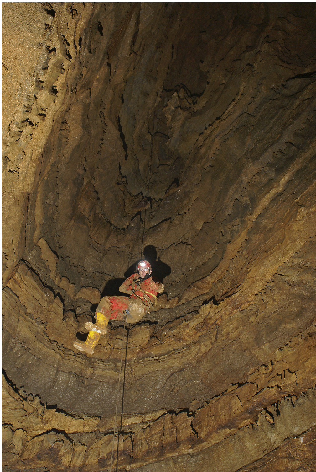
Šini med spuščanjem v novoodkrito brezno Play again.