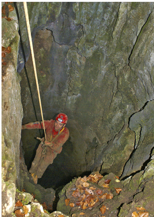
Vhodno brezno.