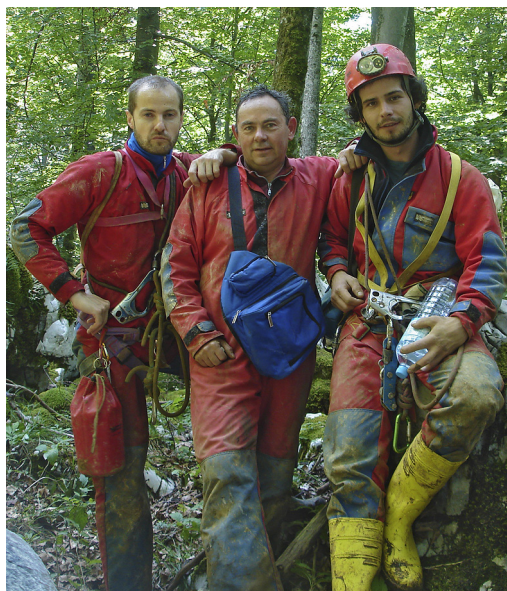
Prvi raziskovalci Čaganke.

prečudovit kapniški rov, poln fascinantnih sigastih tvorb. Srce mi je divje bilo, ko sem počasi napredoval. Nenadoma sem obstal na majhni polici. Pred mano, pod mano in nad mano je bila le tema. Nisem vedel, kaj bi sam s sabo. Čepel sem in metal kamenčke v globino. Nekje spodaj se je slišal pršec vode. Sledilo je vriskanje, rokovanje, objemanje, kajti jama šiiiiiba!