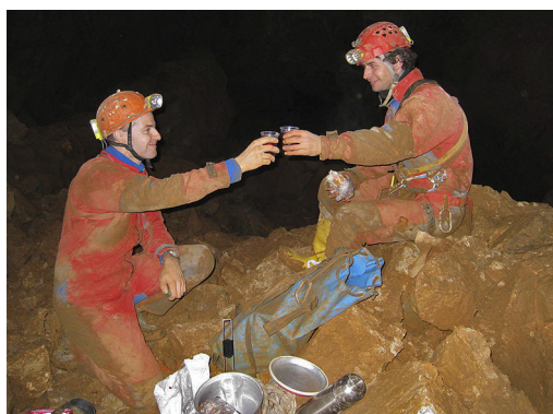
Zdravica na globini 200 m.

v 50 metrov dolg, vodoraven meander, na koncu pa spet v ogromno brezno. Še preden smo se dotaknili dna nove dvorane, pozneje poimenovane Dvorana apetitov, kar je povsem logično, saj so nam takrat apetiti blazno narasli, smo že opazili prehod v še večjo dvorano. Kot po nekakšnem koralnem grebenu, sredi katerega je lepo viden ostanek nekdanj aktivnega toka, smo pridrsali do Akustične dvorane, katere dimenzije je težko opisati. Obstali smo na ogromni polici in nemo zrlj v globino. Zmanjkalo